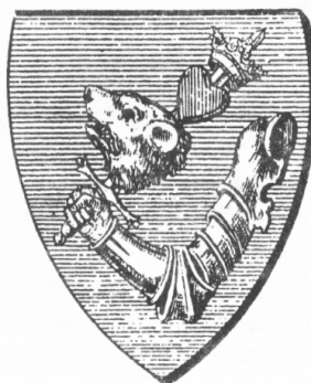
A székely nemzet régi címere

A szerves fejlődés lehetőségeinek elemzése számára célszerű a természeti adottságok által meghatározott tájegység településeinek komplex vizsgálata. Ebben a megközelítésben a fejlődés tulajdonképpen kulturálisan meghatározott folyamat. A kultúra tágabb értelmezésébe beletartozik az emberek közötti viszony, a bizalom jellege, mely meghatározza a gazdasági társulások preferált típusait és méretét a vallás és vele kapcsolatos munkaerőkeresés, valamint a tőkefelhalmozás és fogyasztás közti egyensúly kialakulását meghatározó magatartás. A kultúra hordozza az értékrendszert, mely az emberi cselekvés prioritásait meghatározza. Mindez megnyilvánul a természethez, annak erőforrásaihoz való viszonyulásban is. A fejlődés olyan folya-