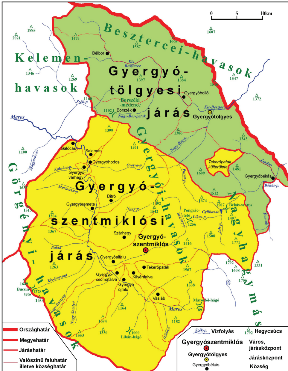
Csik vármegye É-i részének járásai és települései - 1941