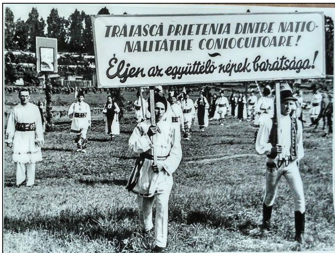
Csíkszeredai felvonulás

megvalósítandó tervek között. Például Gyergyószentmiklós ideiglenes tanácsa 1949. november 16-án határozatot hozott egy járási, valamint a szomszédos járásokkal és a csíkszeredai kórházzal összeköttetést biztosító mentőszolgálat létrehozásáról. A megvalósítás nehezen haladt, ennek érdekében segítséggel fordultak szomszédos falvak helyi ideiglenes néptanácsaihoz. A mentőautó és a mentőállomás építését és a szükséges építőanyagok beszerzésének nagy részét, míg a működés biztosítását egészében Gyergyószentmiklós városa vállalta volna. A továbbiakban szimbolikus „támogatásra” és összefogásra szólította fel a járás községeit. A szimbolikus összeg mindössze egy tojás volt. Az összegyűlt tojást a gyergyóremetei értékesítő-szövetkezet kellett eladja, az összeget pedig az építkezésre kellett fordítani. A mentőautó beszerzését 350.000-400.000 lejre becsülték, ami szerintük közös összefogással könnyen előteremthető lett volna. 85