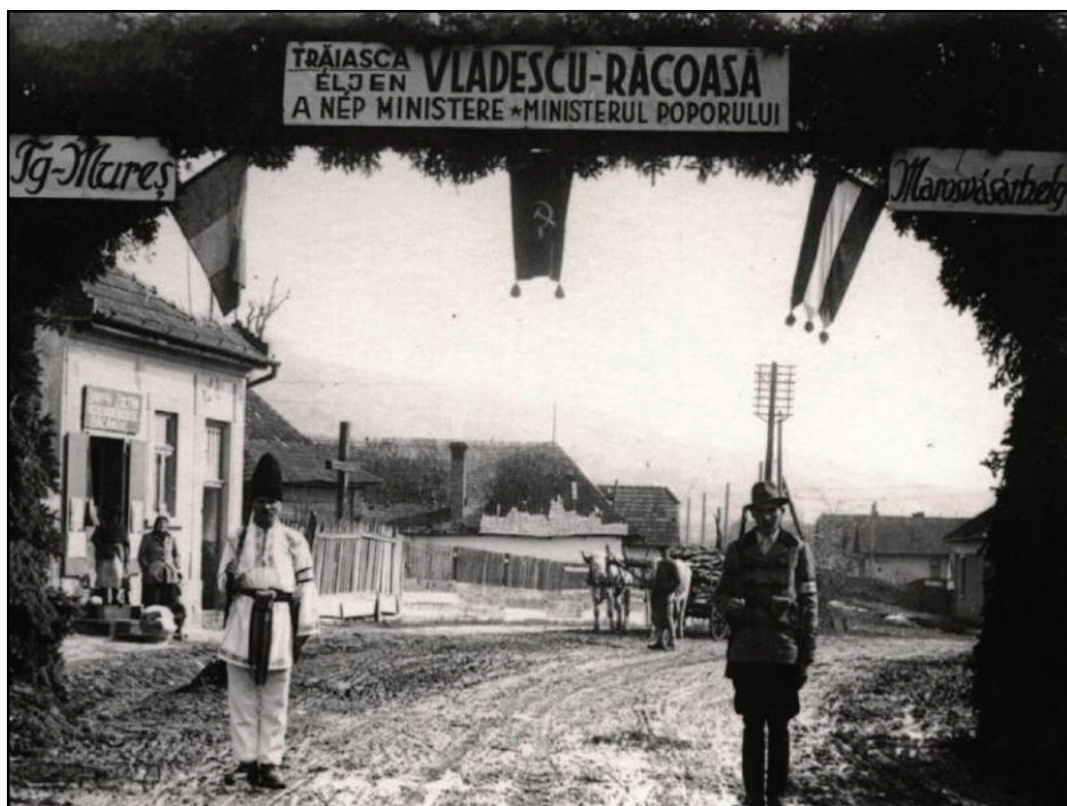
Ideiglenes közigazgatási viszonyok

hogy a magyar ifjúság megtagadta a katonai sorozáson való részvételt, és az utcákon piros-fehér-zöldben járt és Horthy-nótákat énekelt. Mindeközben a román lakosság részéről a jelentésben nem pontosított, sorozatos provokációkat lehetett tapasztalni. 19