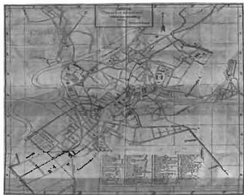
Harta orasului Târgu-Mures, din anul 1923