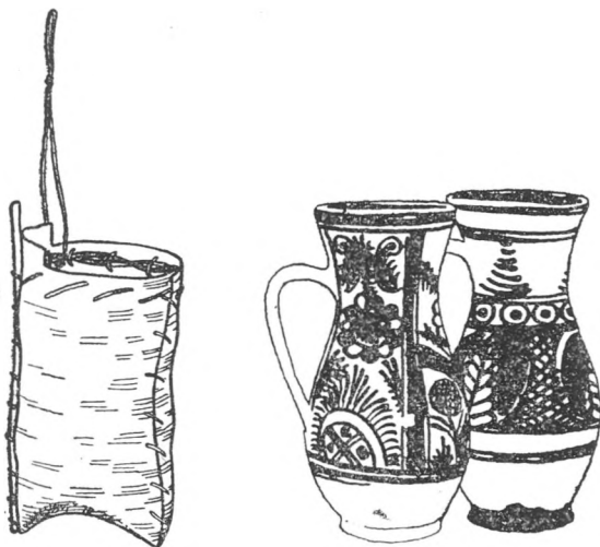
8. Almaszedő nyírfakéreg kászú, Mikháza; kézdivásárhelyi és székelyudvarhelyi kancsók

A vásárbeli famunkák közt a legtöbb helyet az Alsó- és Felsősfalván fenyőfából készült lajtorják , faragott gerendák és esőcsatornák foglalták el. A Nyárád felső vidékén, a havasi erdőkben készült a vásárra hozott óriási halom nyírgseprű , amelyet a köszvényesi és remete cigányok kötöttek és szállítottak le Szeredába. Vesszőkosarat , vesszőszatyrot a selyeiek készítették s hozták a vásárra.