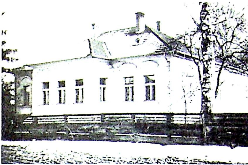
A református parókia (1939)

títására, hanem egyházi választott testülete is volt a falunak, akik beszédtek a papbért, ügyeltek a lakosság erkölcsére, bíraskodtak erkölcsi kihágásokban. Élvezték a lakosok figyelmét a viselkedési, magatartási formákat illetően, s akik felelősséggel gondozták, óvták, gyarapították a gyülekezet va-