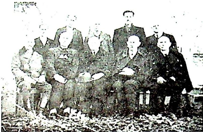
A Hitelszövetkezet igazgatósági- és felügyelőbizottsági tagjai 1942-ben