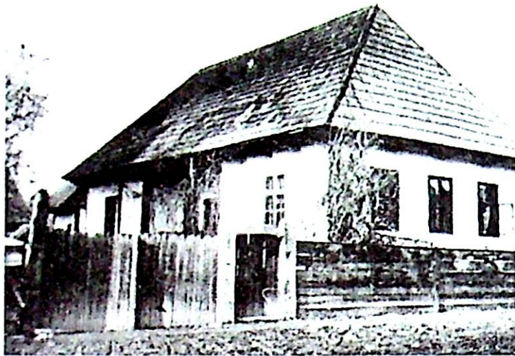
A református kántori lak (1939)