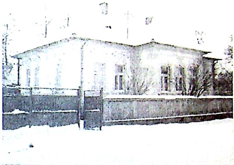
A parókia ma

Mindkettőbe a falu legtekintélyesebb, leginkább tiszteletre méltó tagjait választotta a közösség. Szinte elképzelhetetlen, hogy a két testület között ne lett volna átfedés. Bizonyára gyakorta voltak mindkét testületben ugyanazok az emberek. Ismerve a székelység körében körbejáró tisztsé-