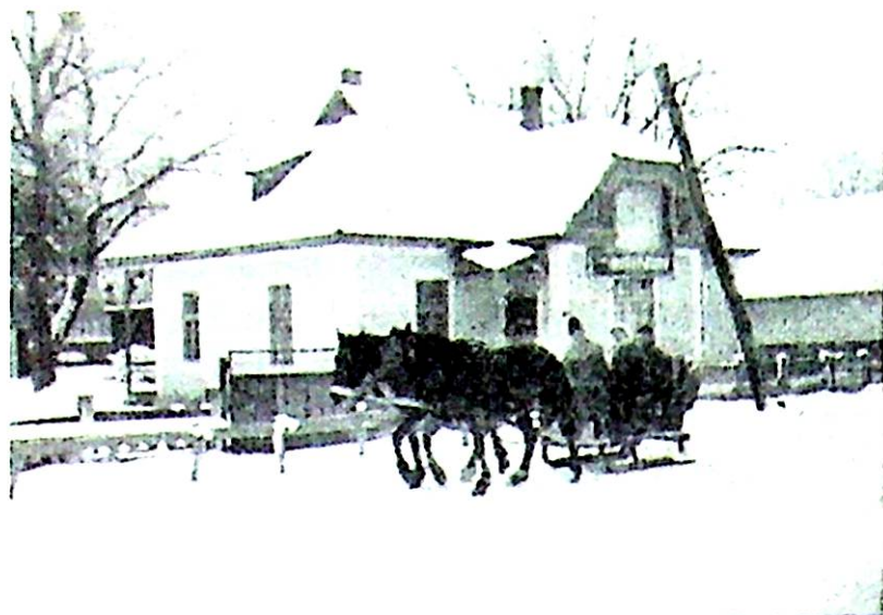
A volt Hitelszövetkezet székháza

tal tőkéhez juthattak. Alakulásakor mindössze 24 tagot számlált a szövetség, azonban 1904-ben már 272-re szaporodott a tagjainak száma. E