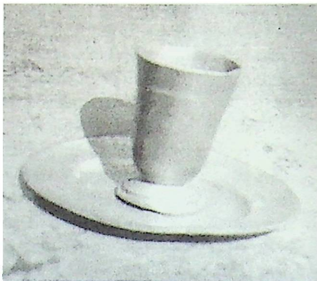
Úrvacsorai pohár tányérral