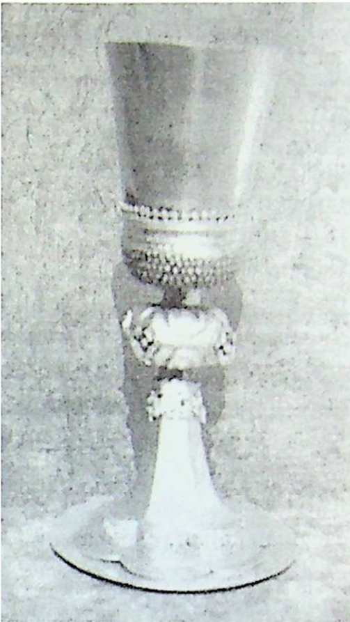
Úrvacsorai kehely tányérral