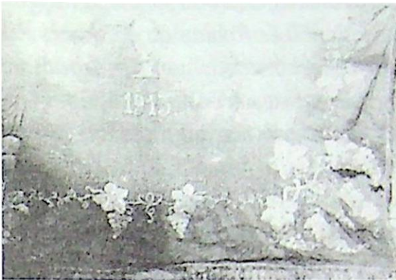
Úrasztali terítő (1913)