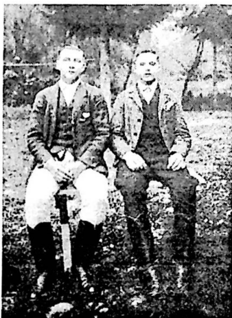
Szovátai legények hagyományos viseletben.