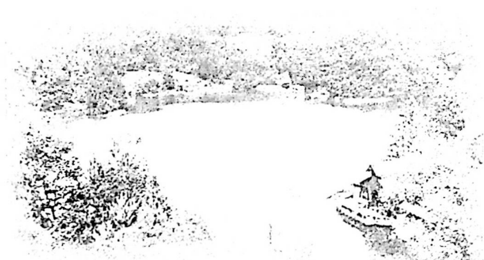
Medve-tó az első világháború előtt. Amatőr felvétel.

zelében levő Parajd községből, az 1287 m magasságú Bucsin tetőn áthaladó műút kőti össze.