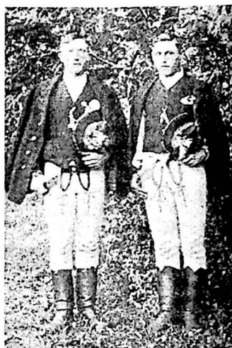
Szovátai legények hagyományos viseletben.