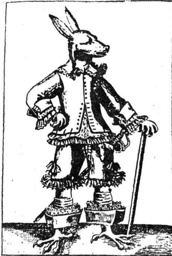
Englands Waffe mit Engels Claws

„Anglia saskarmú rókája”: az arisztokrácia.