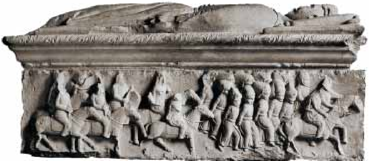
4. Hunyadi János tumbája. Gyulafehérvár. 1533.