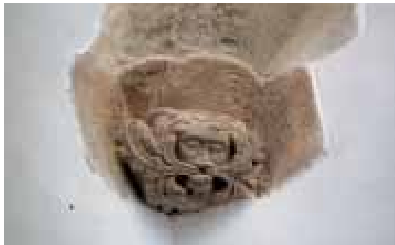
6. Gyámkő. 1520-as évek. Törpény

kiadványainak illusztrációival Ritoókné Szalay Ágnes ismerte fel, 39 s ő illesztette a korábban 40 az erdélyi reneszánsz 15. századi kezdőpontjaként számon tartott emléket valós, 16. századi összefüggéseibe.