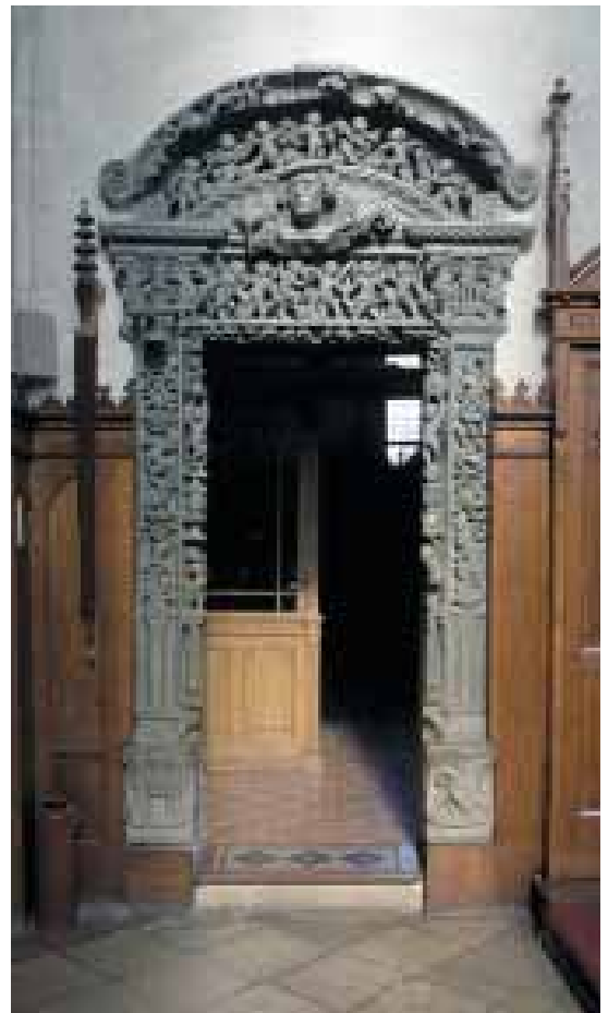
3. Sekrestyeajtó. Kolozsvár. Szent Mihály-templom. 1528.