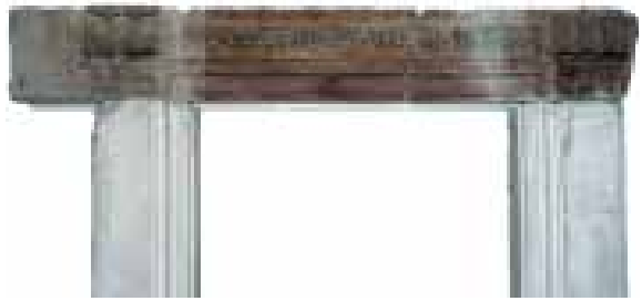
1. Ajtókeret. Kolozsvár. 1514.

Ilyennek ítéljük azt a lendületes volutákkal alátámasztott kolozsvári szemöldök-töredéket, 37 amelynek frízét a számunkra ismeretlen kötődésű Bernardus Pictor – kétségtelenül kolozsvári polgár – 1514-es, füllestáblába foglalt felirata díszíti. Talán ide sorol-