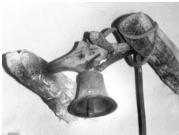
Berethalom, evangélikus templom, középkori sekrestyecsengő felfüggesztése

E régi emlékek Erdély népei múltjának fontos forrásai, melyeknek számbavételét halk, de nyomatékos figyelmeztetésnek is szánjuk, hiszen gyűjtésünk során találkozhattunk a villamos harangozás érdekében megcsontított középkori harangkoronával, helytelen felfüggesztéssel és az elhasadt régi harangok minden dokumentáció nélküli újraöntésével vagy dilettáns hegesztésével. A ránk maradt értékek jobb megbecsüléséhez talán az alábbiak is hozzájárulnak.