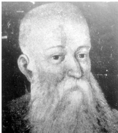
77. kép. Teleki Mihály képmása a sáromberki kastélyban.