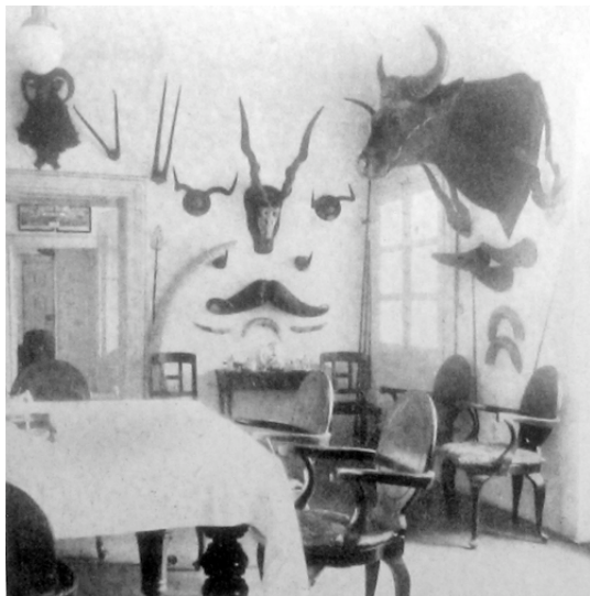
73. kép. A sárosteri kastély ebédlője, vadásztrófeákkal.