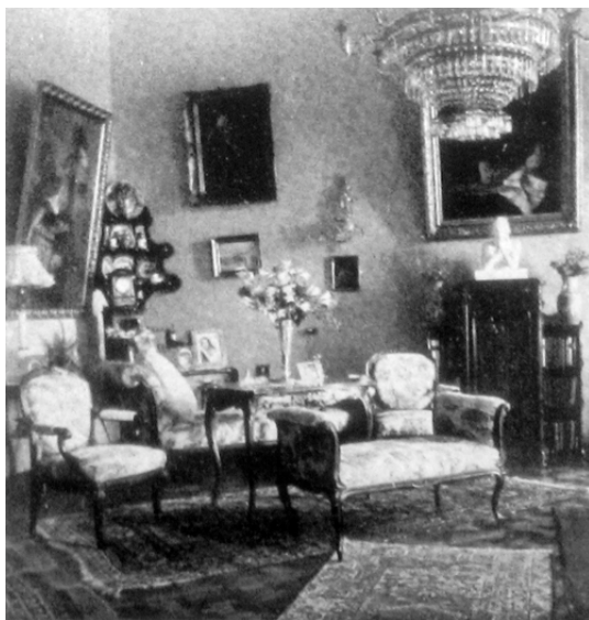
83. kép. A hosszúfalvi kastély egyik szobája.