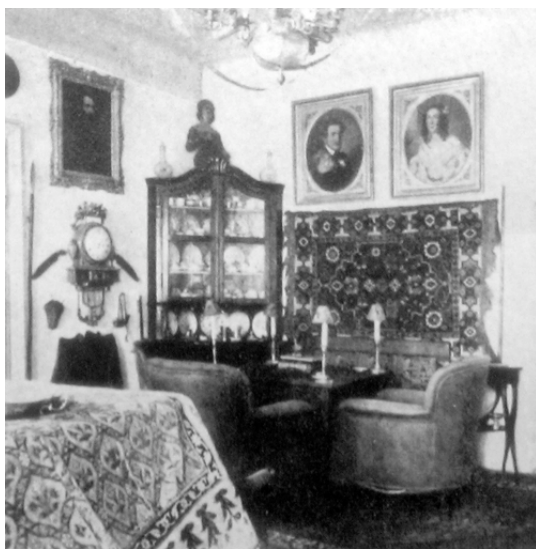
74. kép. A kártyaszoba a sárosteri kastélyban.