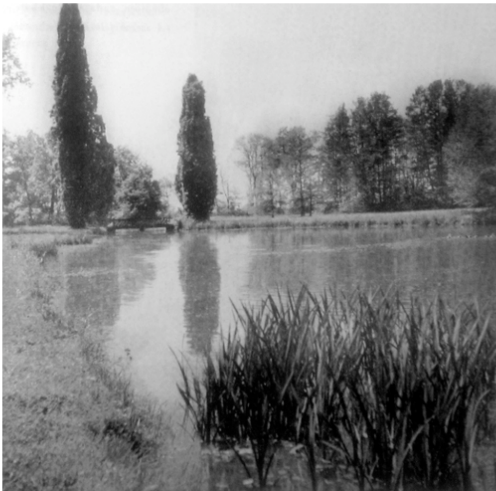
72. kép. Marosparti részlet a sáromszék kastély parkjából.