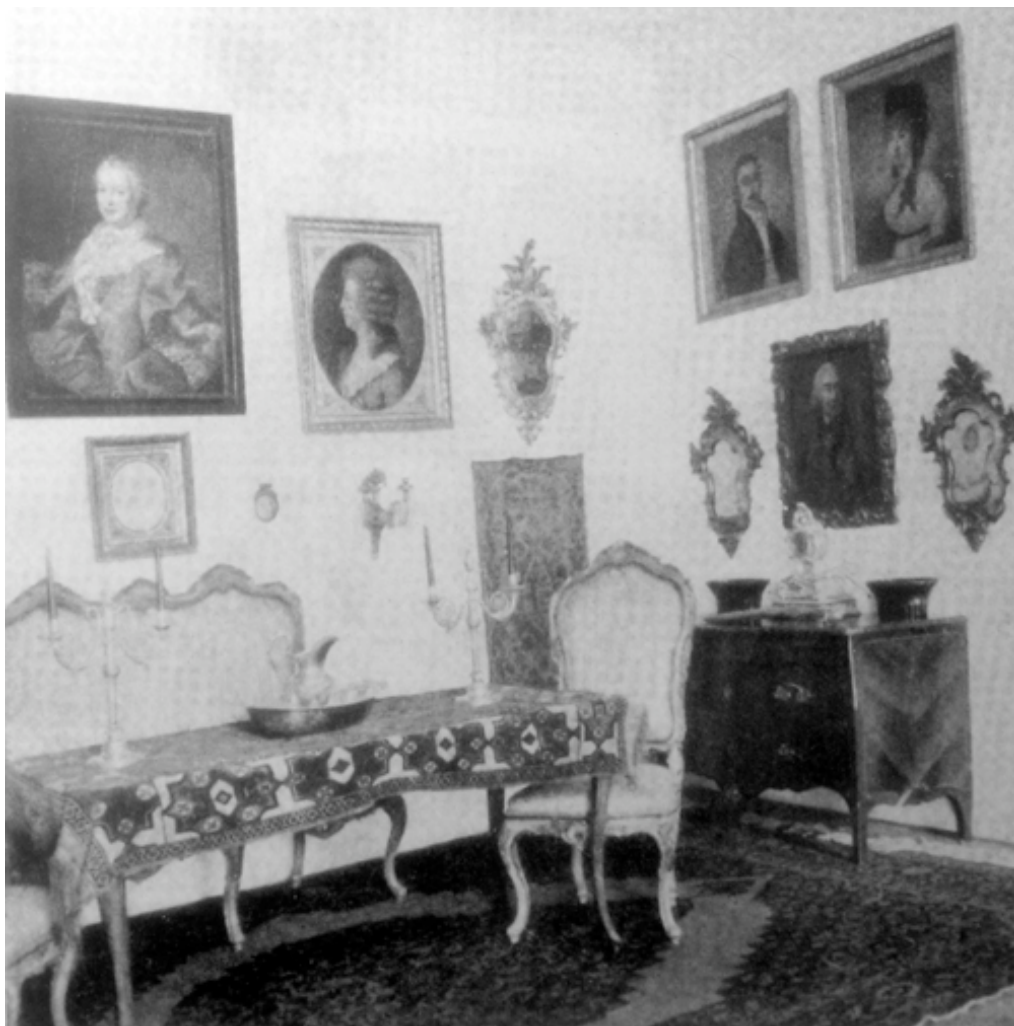
79. kép. A sáromszéki kastély Mária Terézia-szobája.