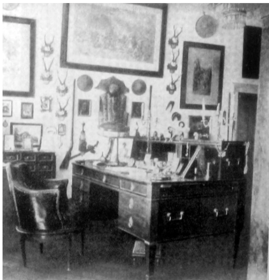
75. kép. Teleki Sámuel gróf erdélyi kancellár íróasztala a sáromberki kastélyban.