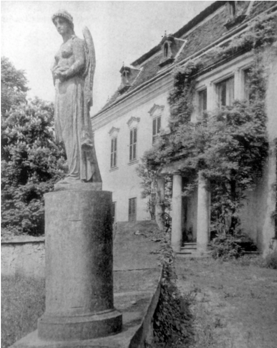
81. kép. A bethleni Bethlen-kastély.