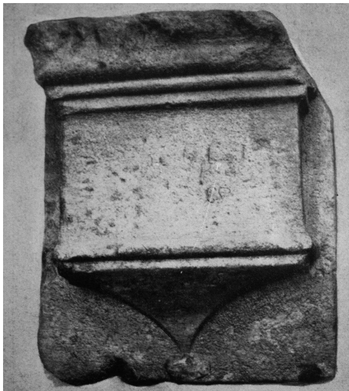
53. Gyámkő a gyalui várból. 1480—1500 körül. Gyalu, Barcsay kastély.