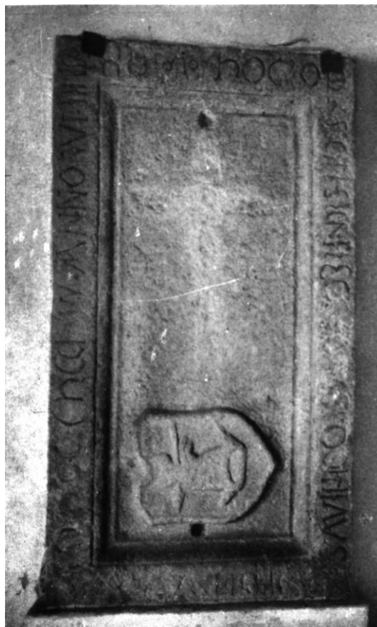
58. Szilágycseh, ref. templom. Csehi Vajda István kriptaköve. 1500.