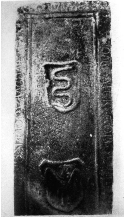
57. Bethlen, ref. templom. Bethlen Gergely († 1500) sírköve.