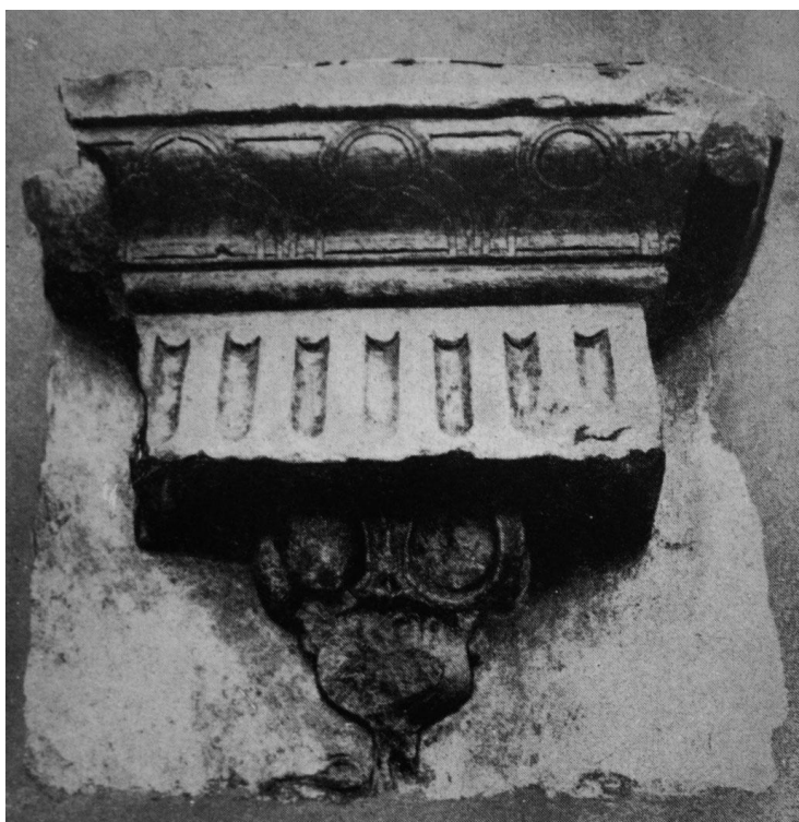
54. Gyámkő a gyalui várból XIV. század (?). Gyalu, Barcsay kastély.