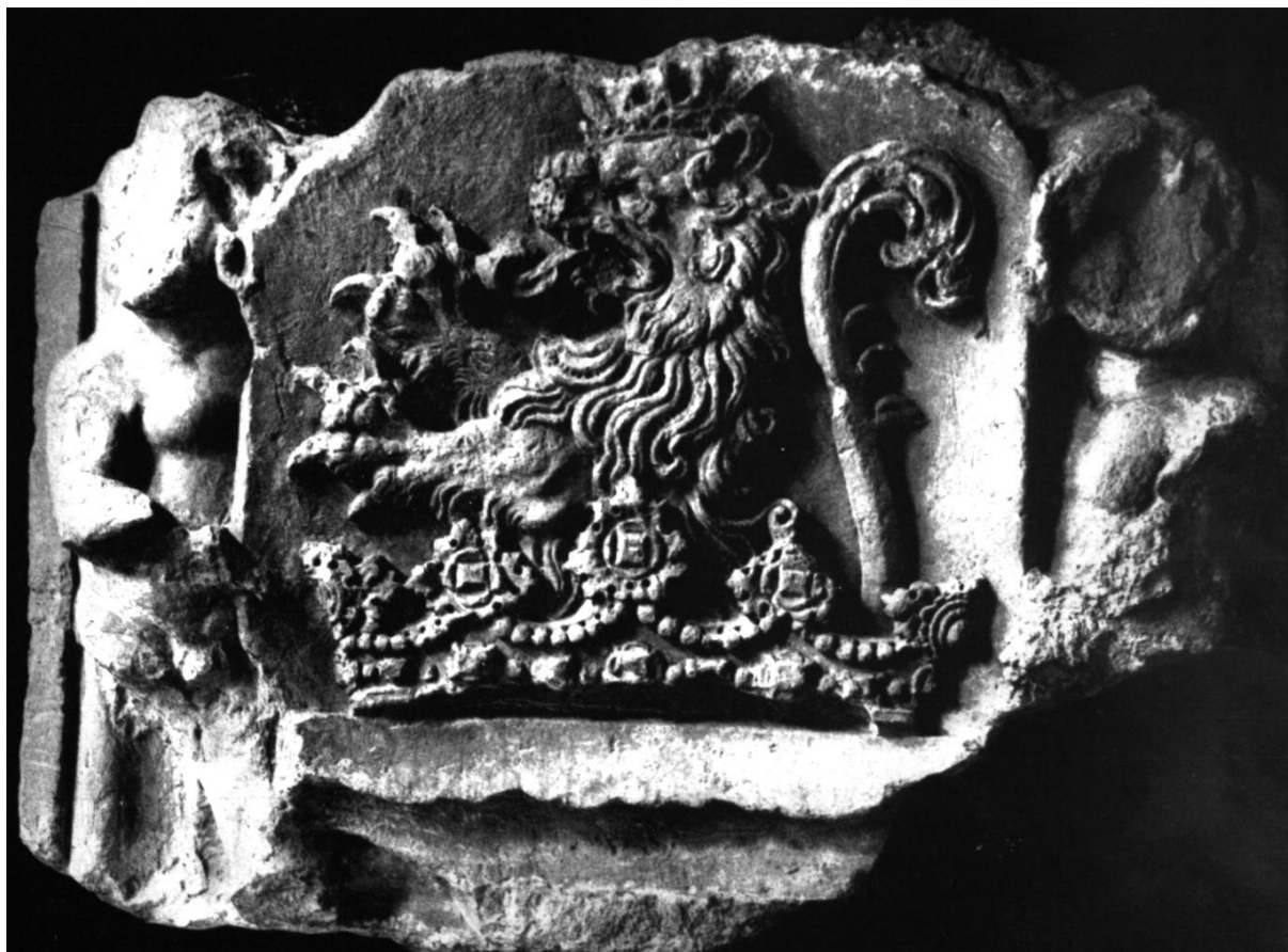
52. Geréb László erdélyi püspök címere a gyalui várból. 1480—1500 körül. Kolozsvár, Erdélyi Nemzeti Múzeum.