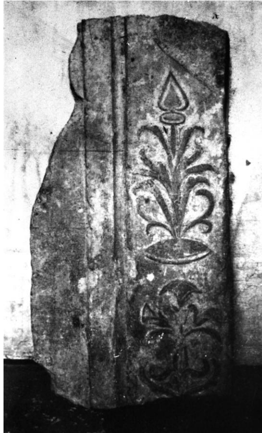
55. Ajtóféltöredék a gyalui várból. 1480—1500 körül.