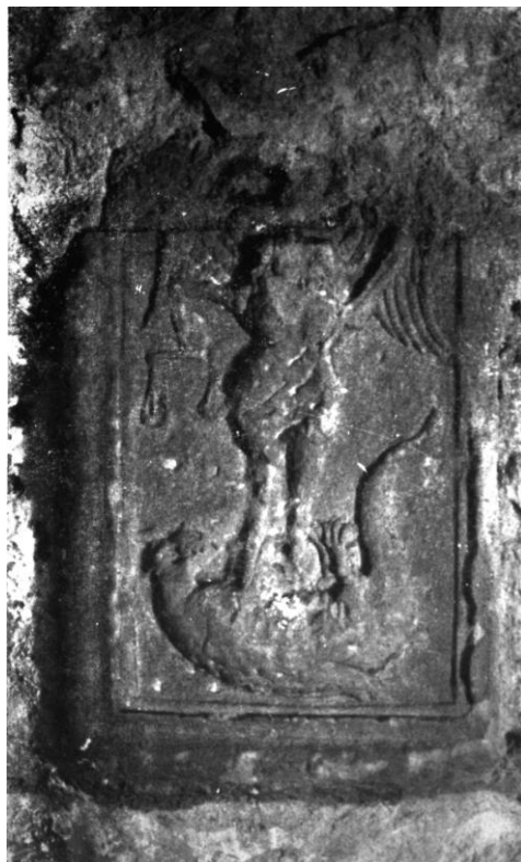
56. Dombormű Szent Mihállyal. 1480—1500 körül. Gyalu, Barcsay kastély.