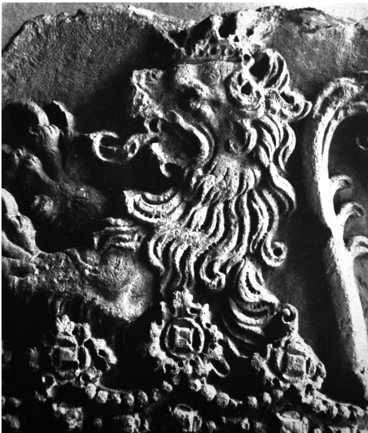
51. Geréb László erdélyi püspök címere (részlet). Kolozsvár, Erdélyi Nemzeti Múzeum.