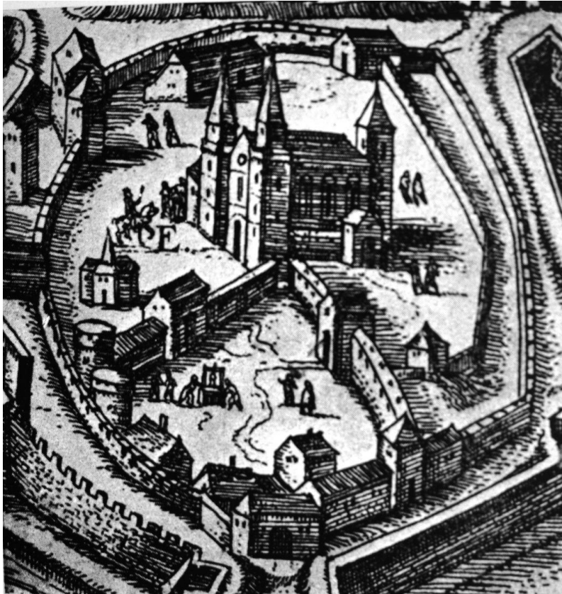
66. A váradi püspöki vár. G. Houfnagel rajza után készült metszet. 1618.