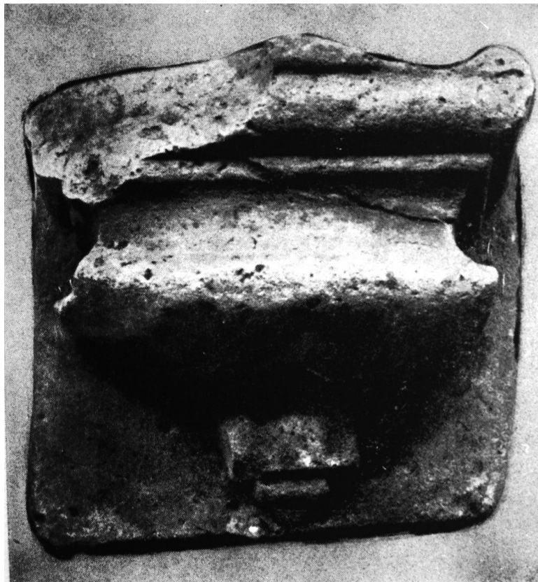
67. Gyámkő a váradi püspöki palotából. 1506—1512 körül. Nagyvárad, Múzeum.