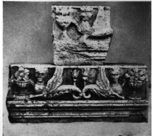
68—69. Töredékek a váradi püspöki palotából. 1506—1512 körül. Nagyvárad, Múzeum.