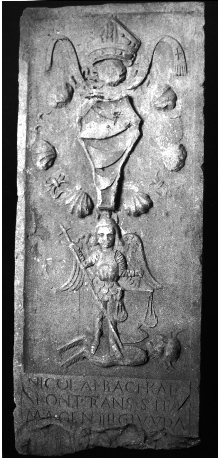
61. Bachay Miklós erdélyi püspök címerköve. 1503—1504 körül. Déva, Múzeum.