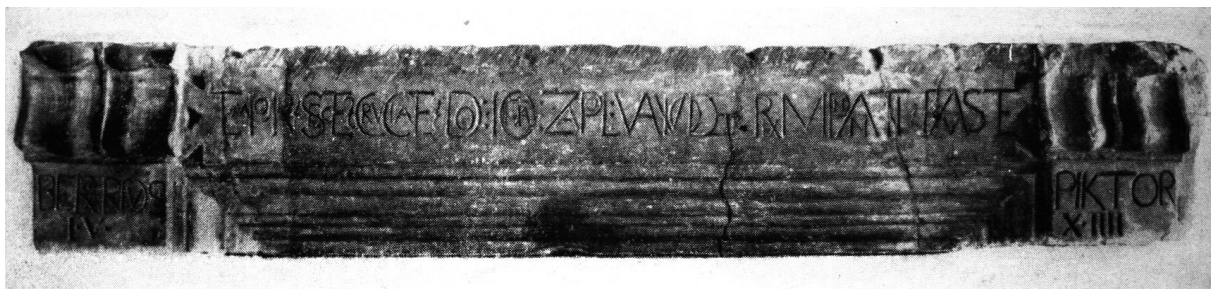
63. Ajtószemöldökkő Bernardus festő kolozsvári házából. 1514. Kolozsvár, Erdélyi Nemzeti Múzeum.