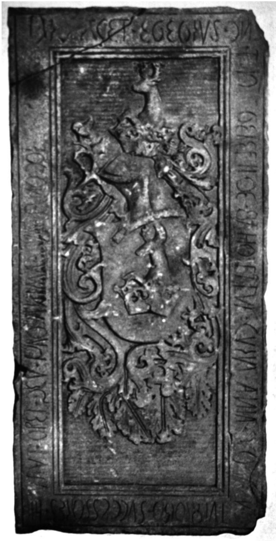
65. Gyerő Tamás sírköve. 1510 körül. Kolozsvár, Erdélyi Nemzeti Múzeum.