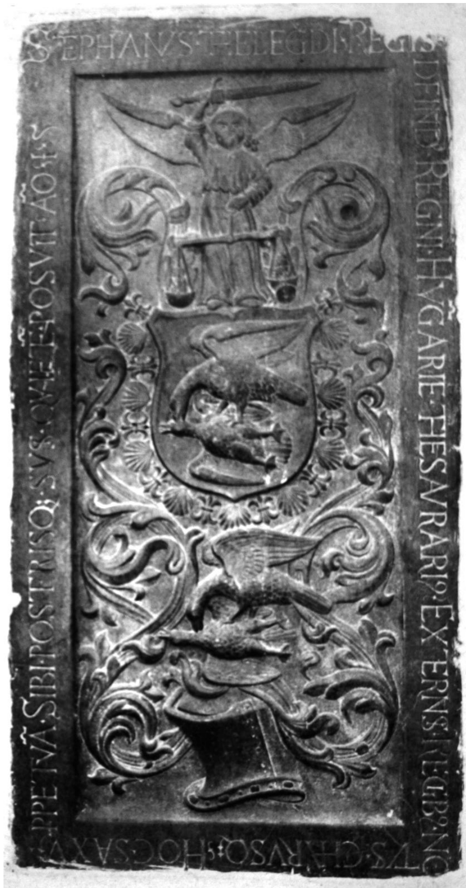
70. Mezőtelegd, ref. templom. Thelegdi István kriptaköve. 1507—1514 között.