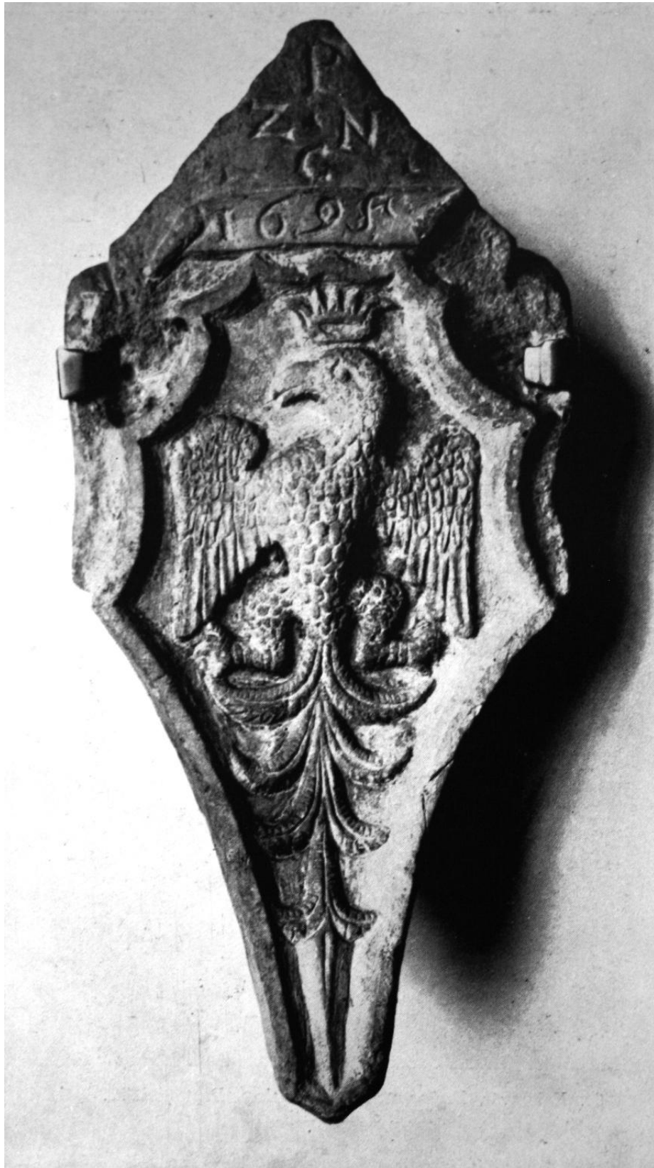
62. Jagello címer a görgényi várból, XVI. század eleje. Budapest, Magyar Történeti Múzeum.