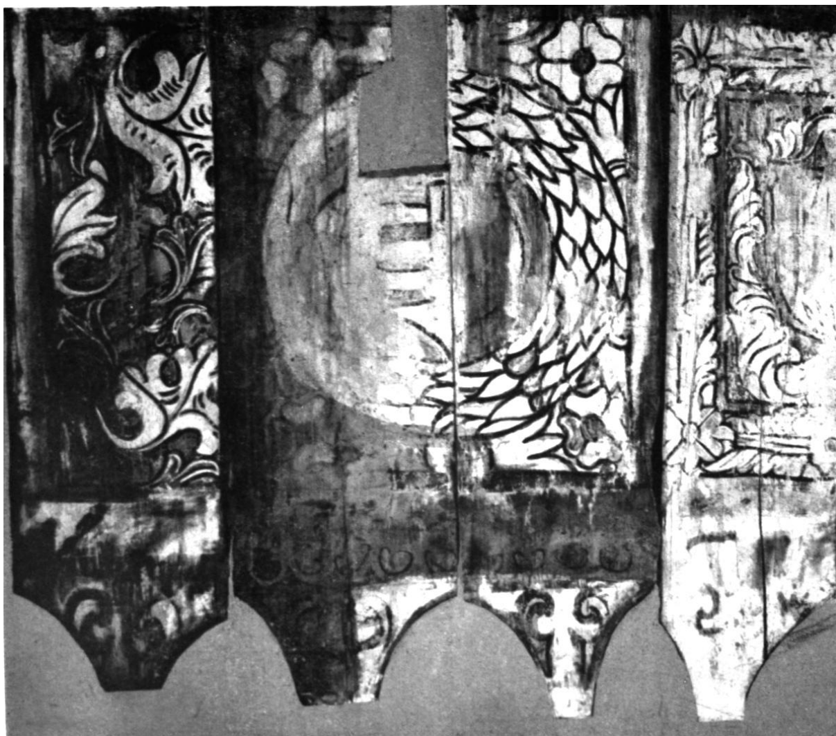
205. Homoródszentpéter, unit. templom. Festett karzat töredékei. 1520 körül.