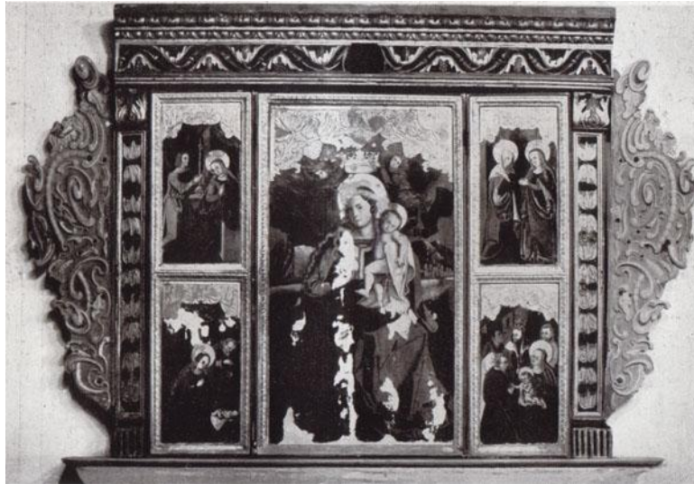
214. A kisebbik csíksomlyói oltár. 1520 körül. Kolozsvár, Erdélyi Nemzeti Múzeum.