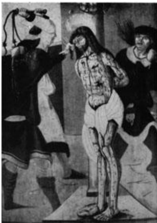
211—212. Festmények a csíkszentléleki oltár külső szárnyairól. 1510. Budapest, Orsz. Magy. Szépművészeti Múzeum.