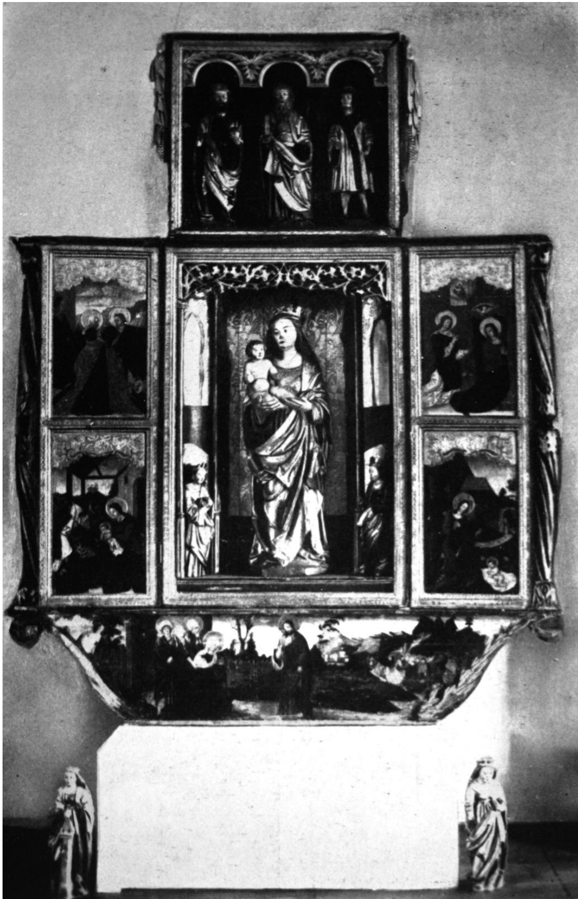
210. A székelysombori szárnyasoltár. 1540—1550 körül. Kolozsvár, Erdélyi Nemzeti Múzeum.