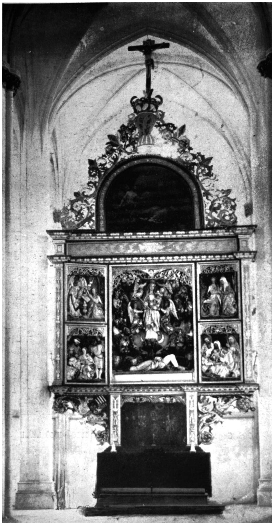
209. Szászsebes, ev. templom. Szárnyasoltár. 1524 után.