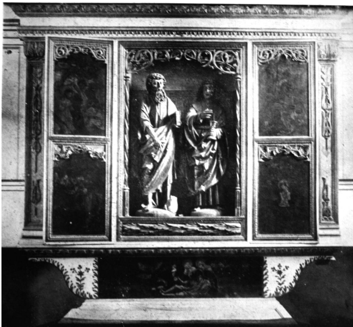
207. Rádósi, ev. templom. Szárnyasoltár. 1525.