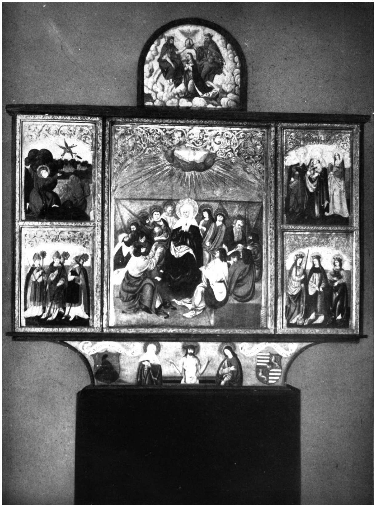
213. A csíkszentléleki szárnyasoltár. 1510. Budapest, Orsz. Magy. Szépművészeti Múzeum.