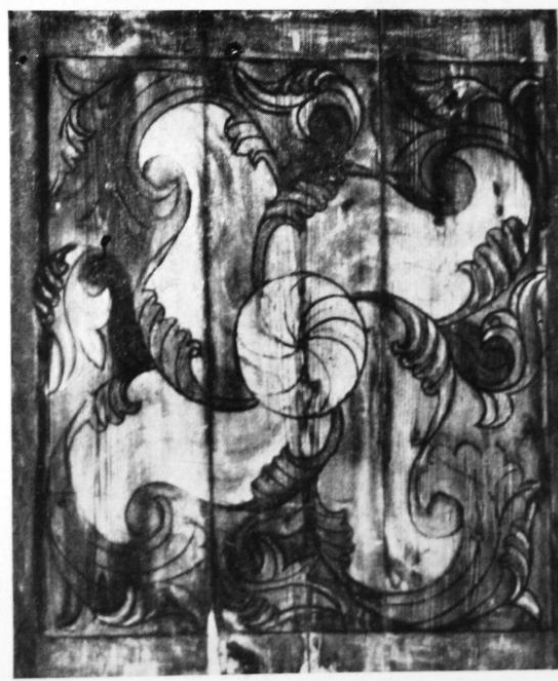
201—204. Részletek az ádámosi festett mennyezetről. 1526. Budapest, M. Történeti Múzeum Néprajzi Tára.