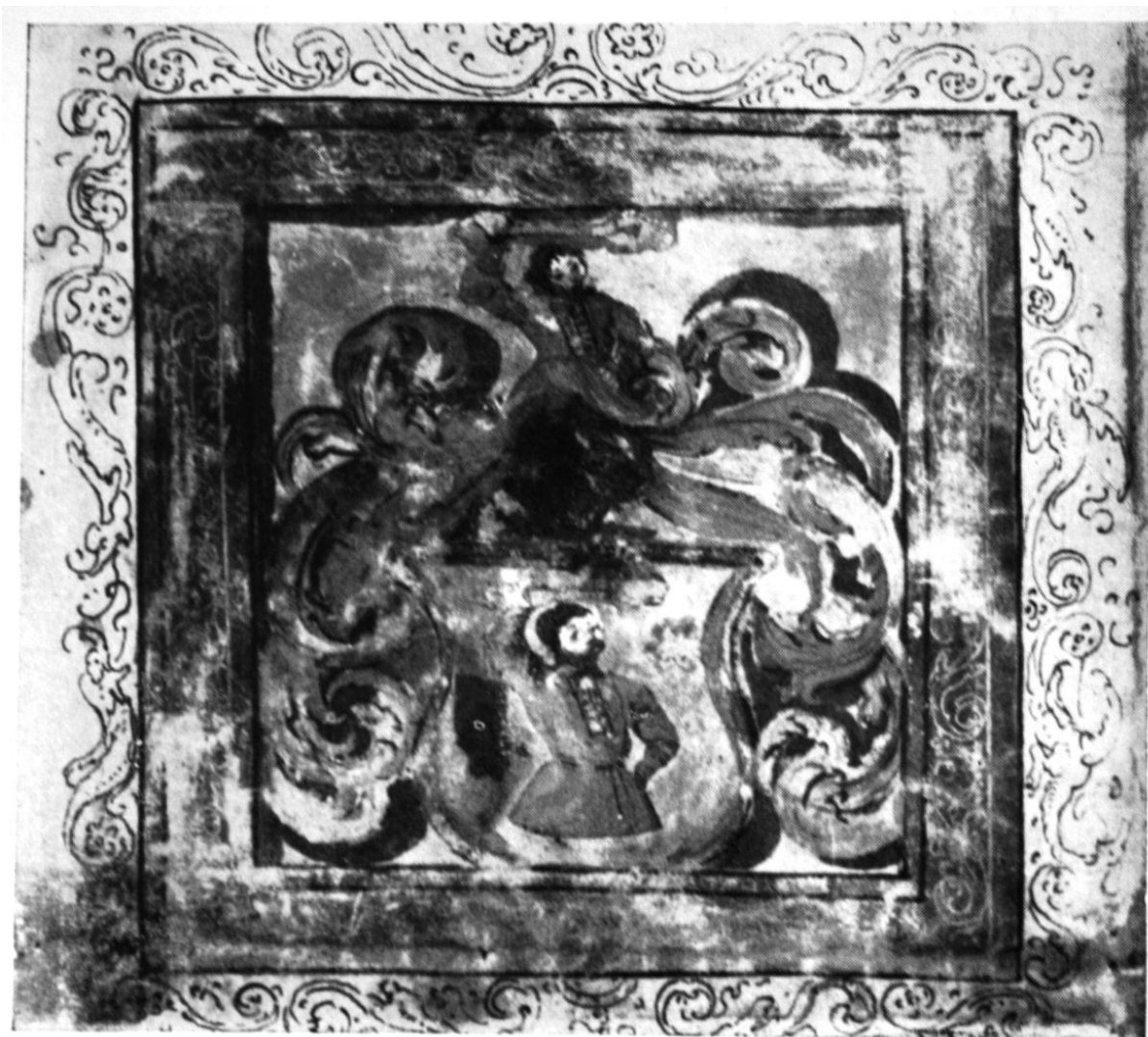
233. Krasznai Pándy Ferenc címereslevele. 1526. Budapest, Országos Levéltár.