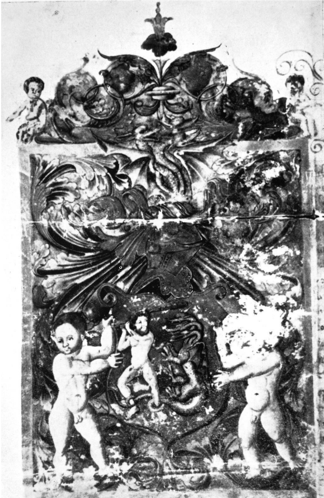
232. Vásárhelyi Gergely címereslevele. 1526. Budapest, Magyar Nemzeti Múzeum levéltára.