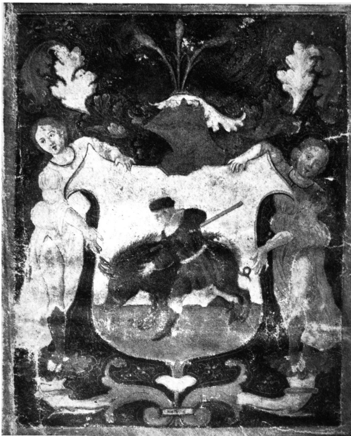
230. Dobai Demeter címereslevele. 1519. Budapest, Magyar Nemzeti Múzeum levéltára.