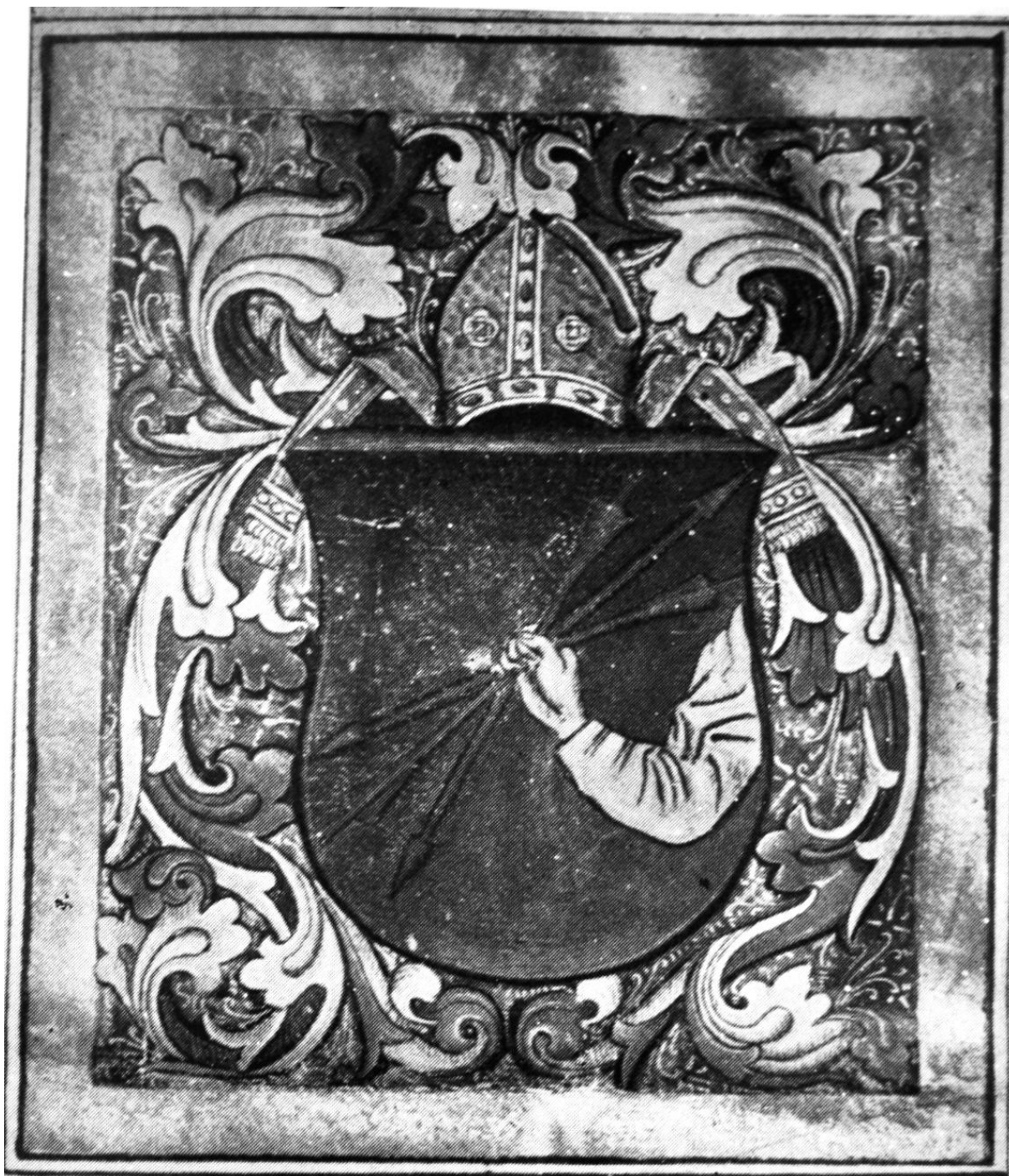
228. Lázói János címerlevele. 1489. Budapest, Országos Levéltár.