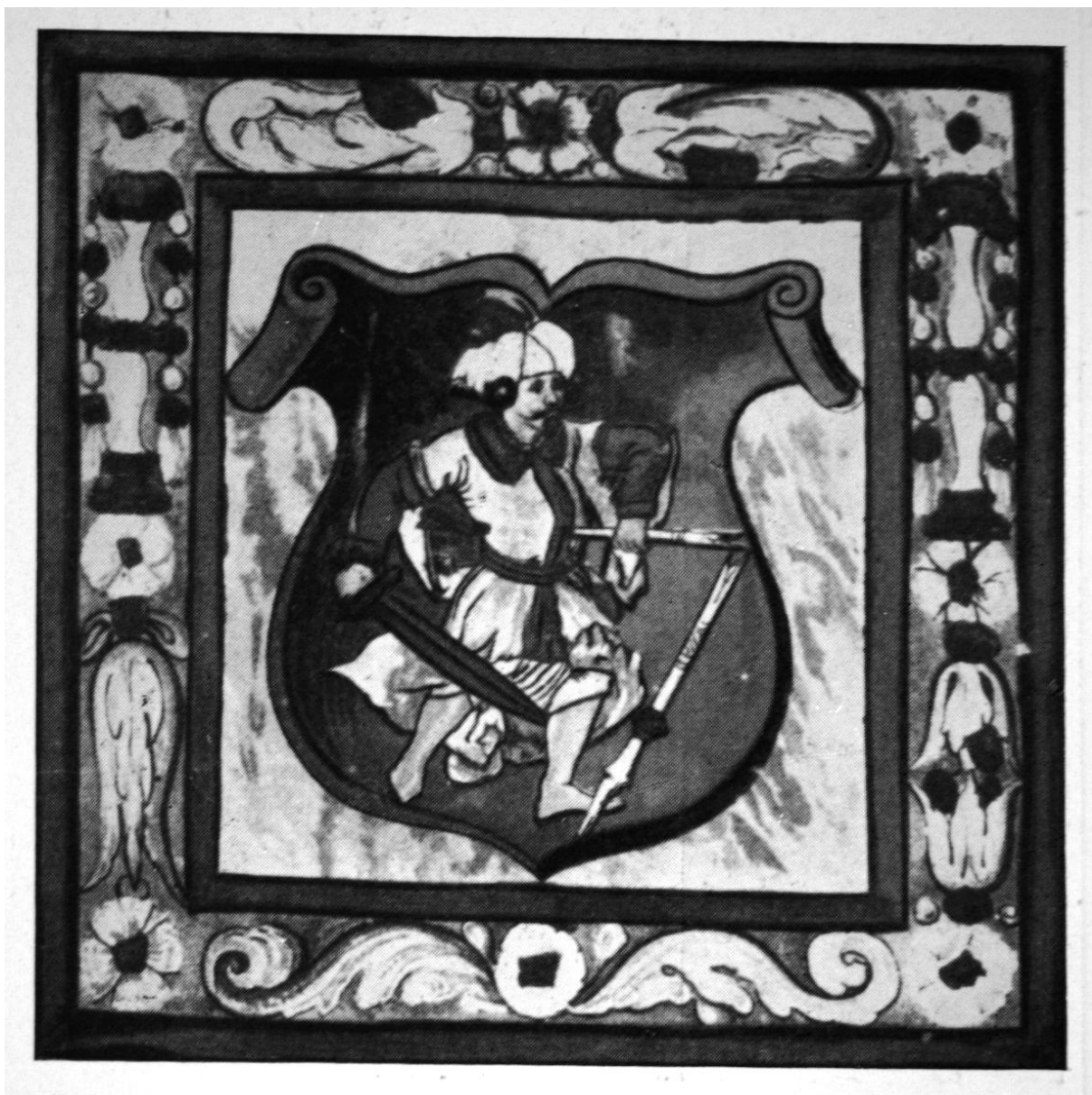
234. Dévai Péter címereslevele. 1538. Holléschan. (másolat után).