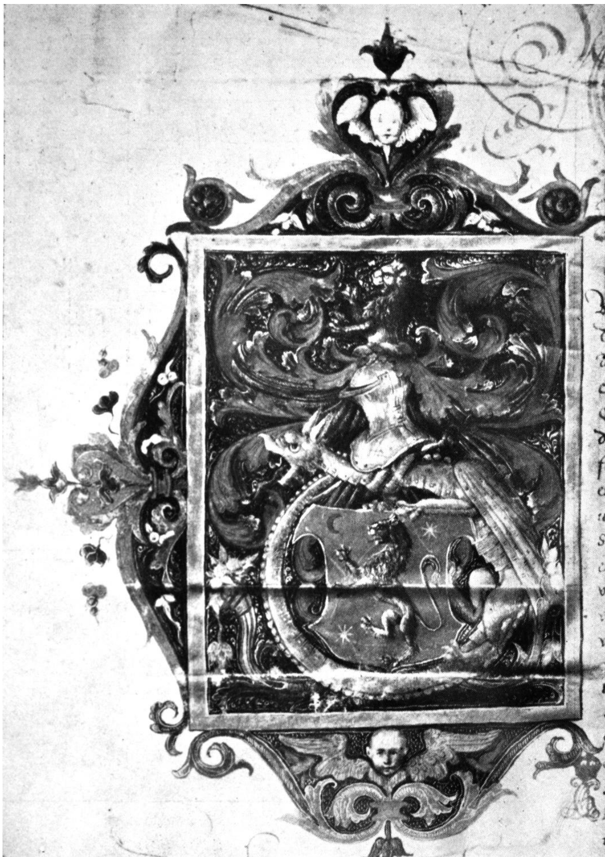
231. Zalczer Lőrinc címerlevele. 1525. Budapest, Országos Levéltár.