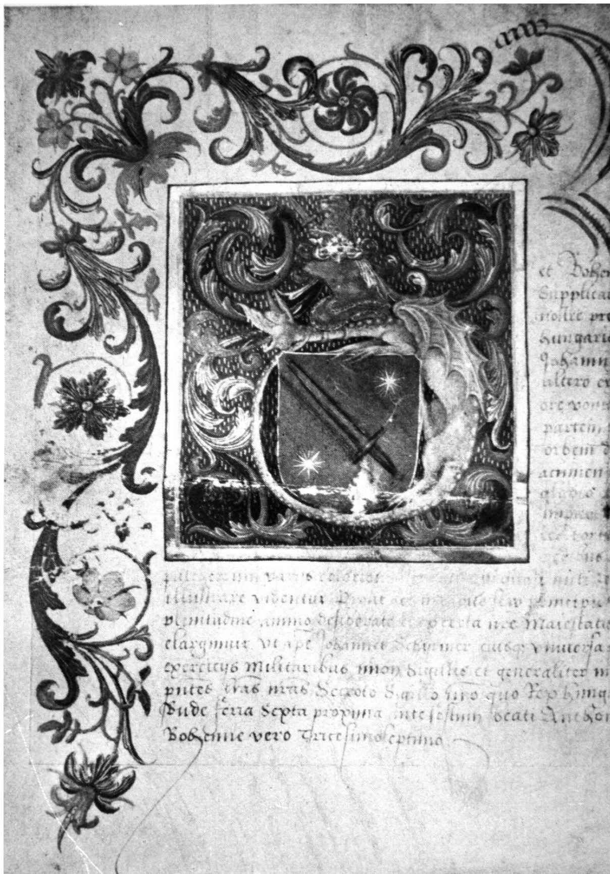
227. Schyrmer János címereslevele. 1507. Kolozsvár, Erdélyi Nemzeti Múzeum.