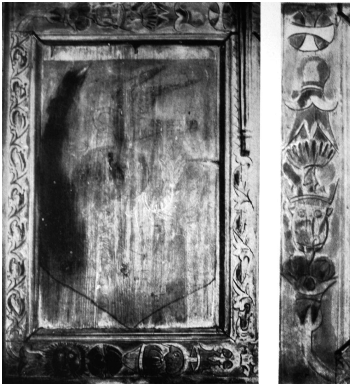
264—265. Részletek a csíksomlyói stallumról. 1530—1540 körül. Kolozsvár, Erdélyi Nemzeti Múzeum.