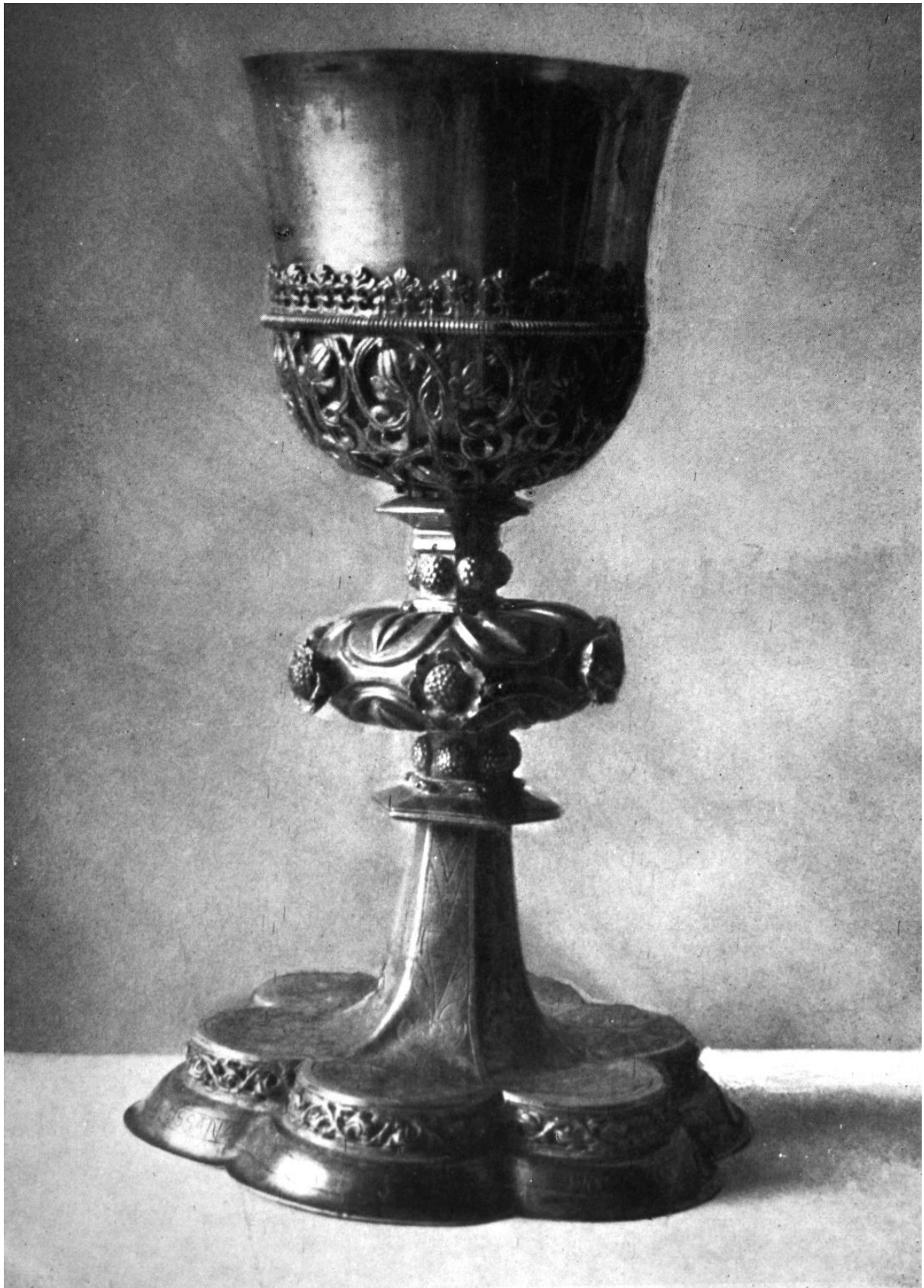
267. Csíkkarcfalva, r. k. templom. Kehely. 1540.