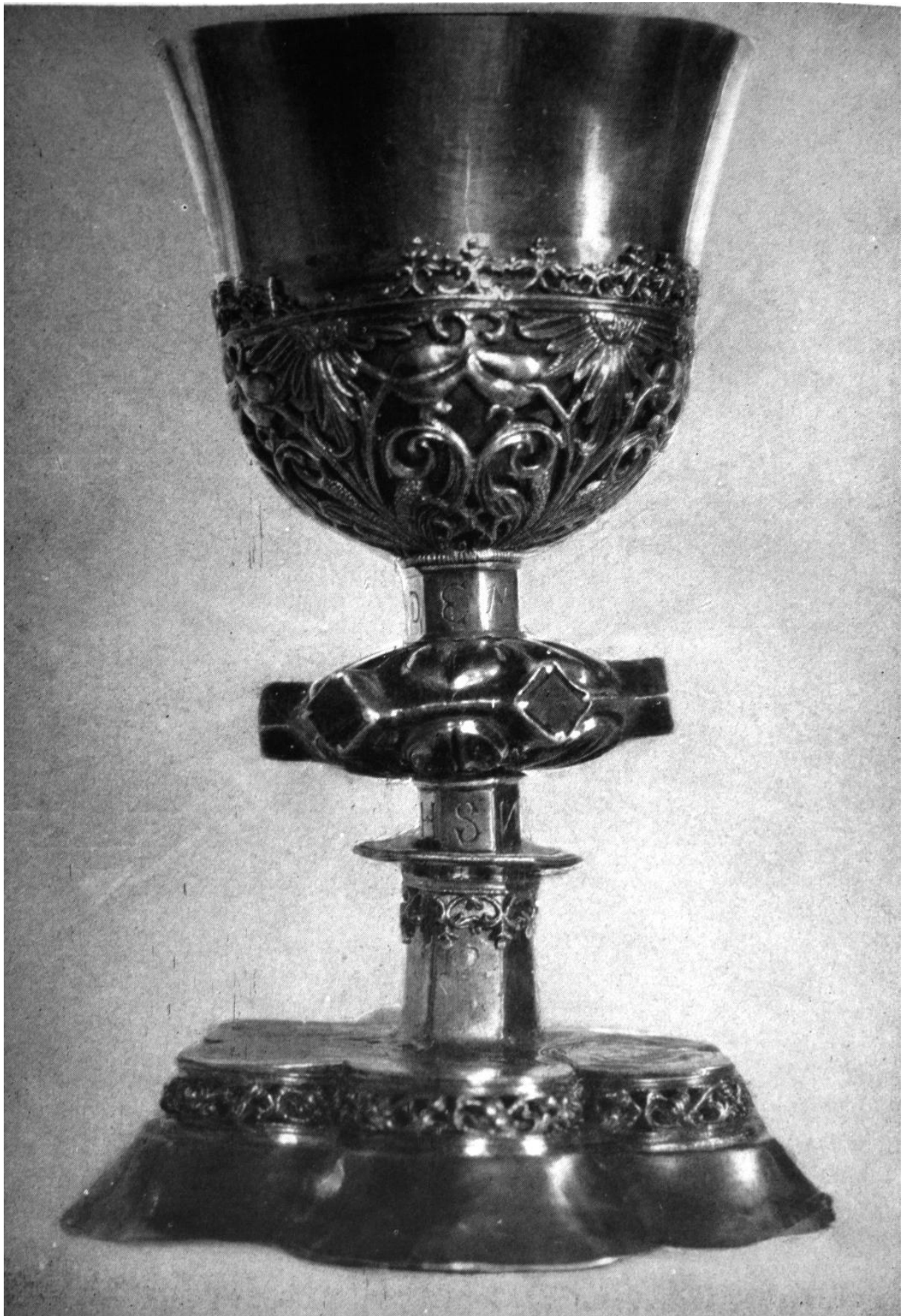
268. Nagykászon, r. k. templom. Kehely. 1530 körül.