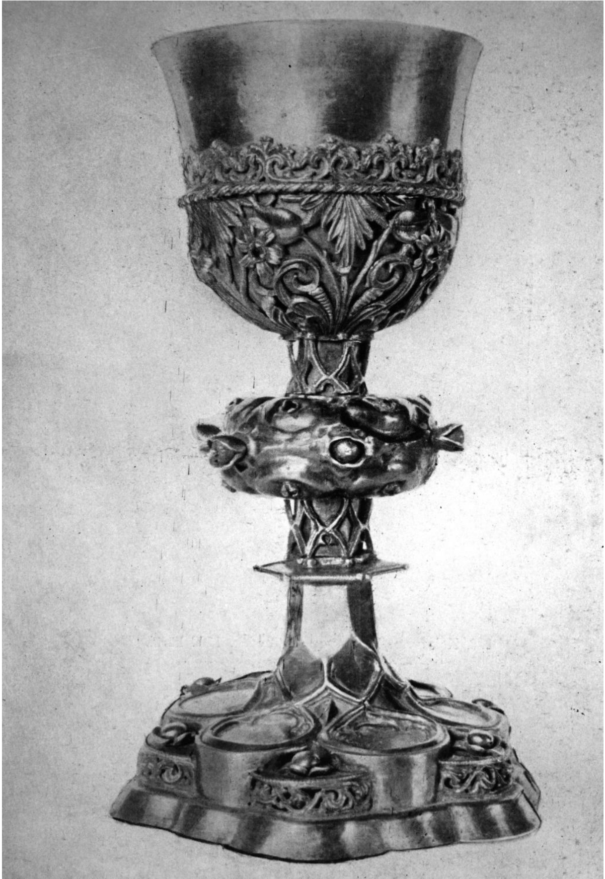
269. Völcz, ev. templom. Kehely. 1536.