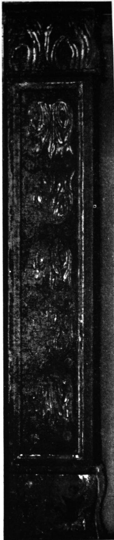
263. Részlet a nagyobbik csíksomlyói oltárról. 1510—1520 körül. Kolozsvár, Erdélyi Nemzeti Múzeum..