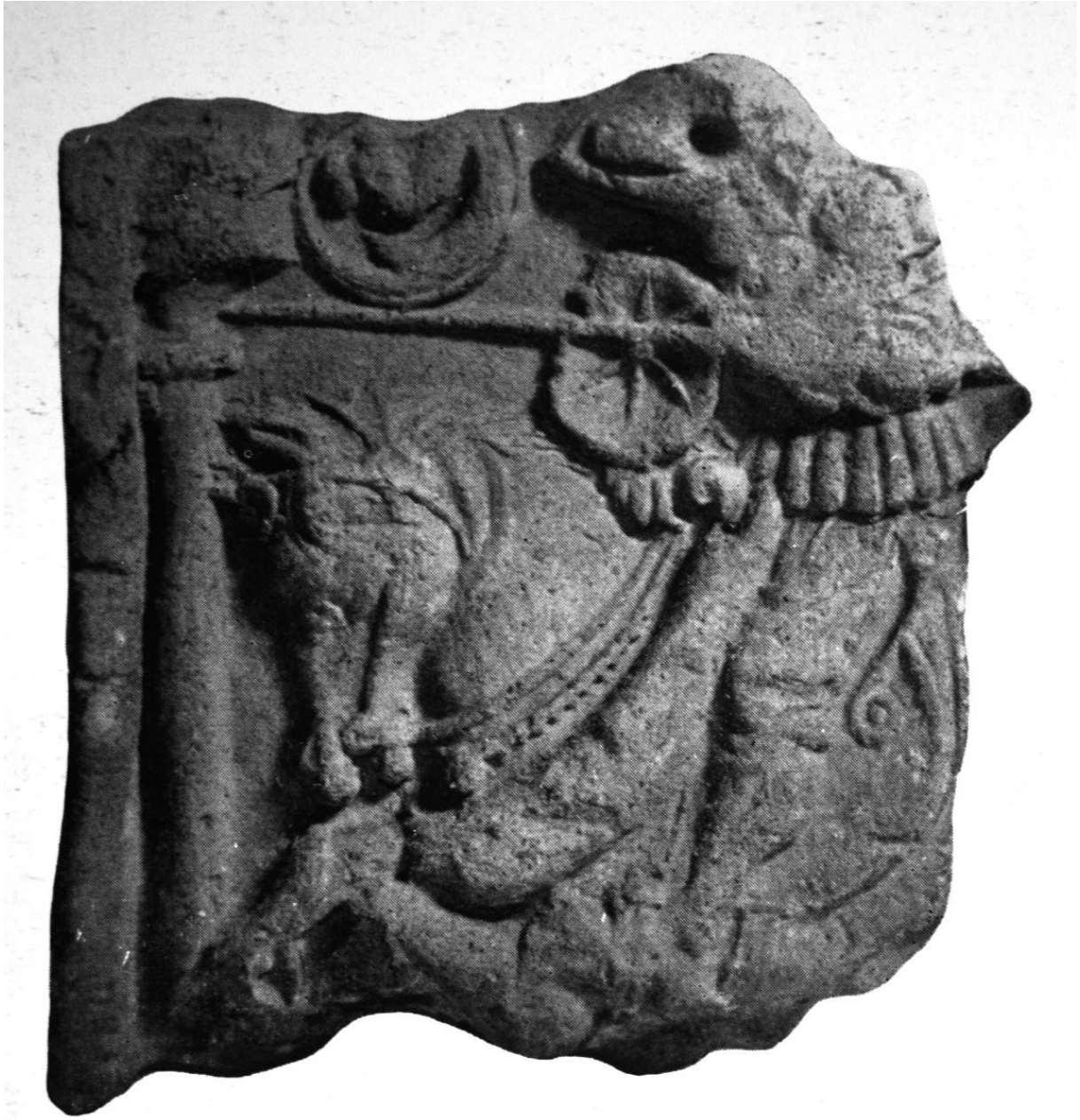
270. Kolozsvári kárhacsempe töredék. 1500 körül. Kolozsvár, Erdélyi Nemzeti Múzeum.