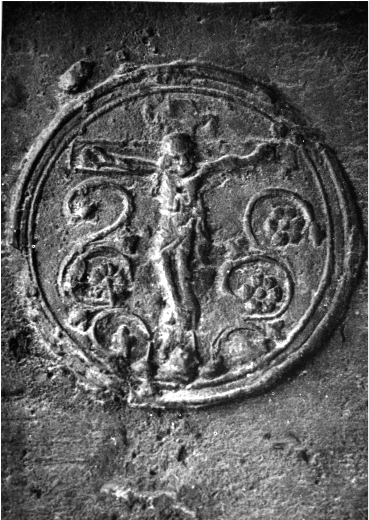
271. Marosszentanna, ref. templom. Dombormű a harangról. 1497.