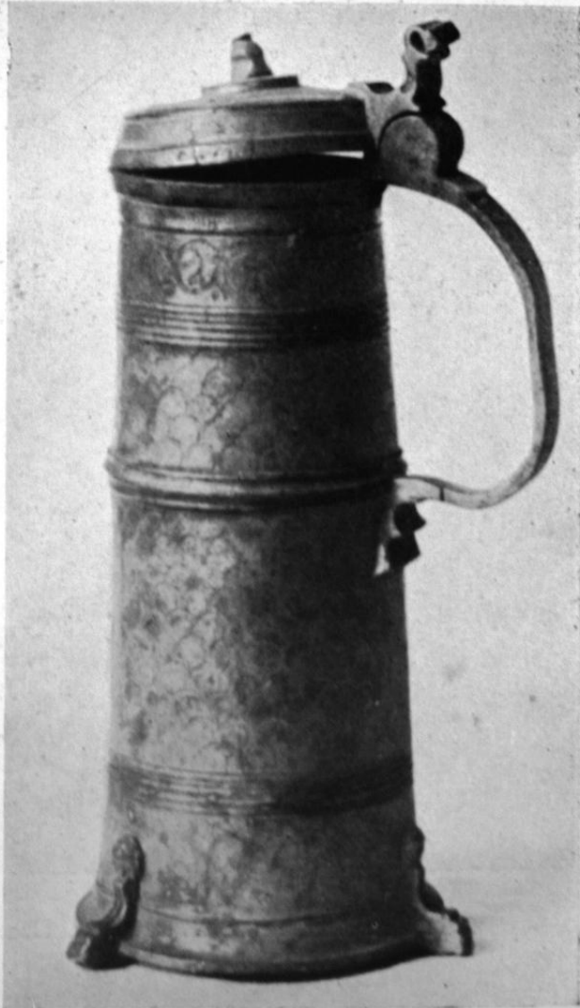
272—273. a kolozsvári egykori Szent Péter egyház ónkannája. 1537. Kolozsvár, unit. egyház.