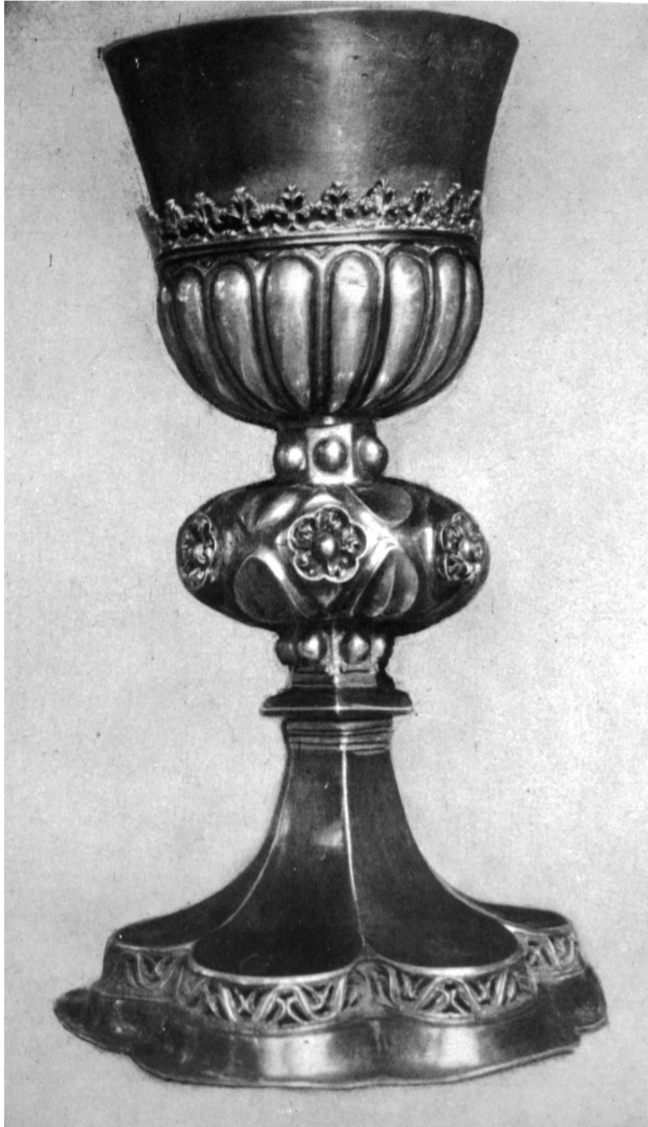
266. Maksa, ref. templom. Kehely. 1512.