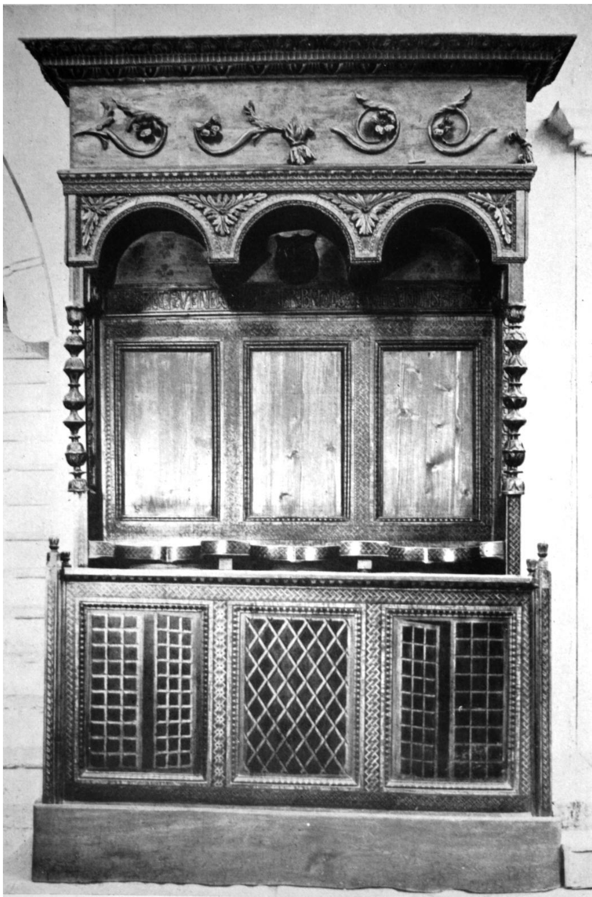
254. Beszterce, ev. templom. Bethleni Benedek stalluma. 1516.