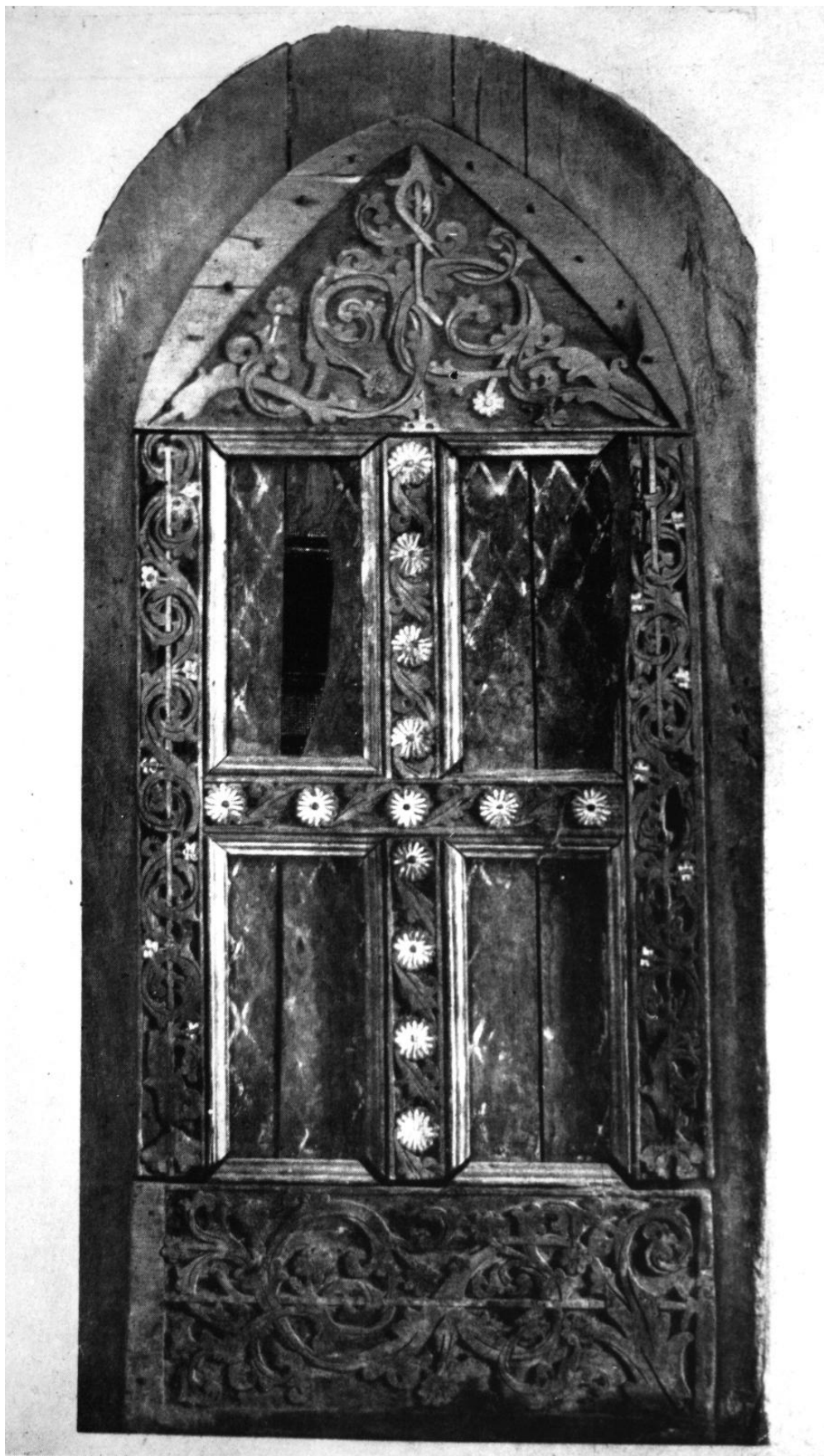
261. Nyárádszentlászlói ajtó. 1520—1530 körül. Kolozsvár, Erdélyi Nemzeti Múzeum.