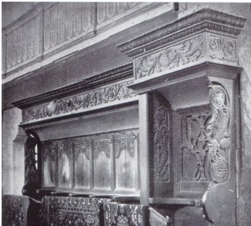
257. Prázsmár, ev. templom. Nagy stallum. 1526 (?)