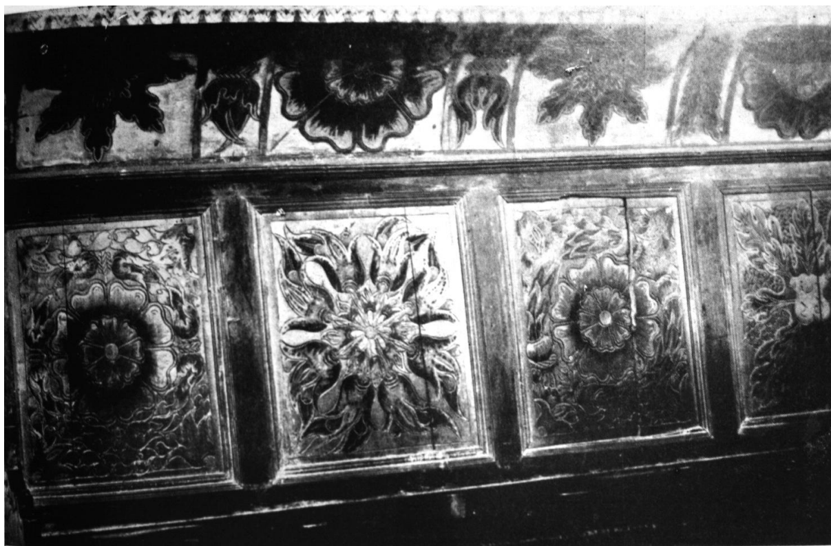
258. Részlet a baromlaki stallumról. 1526.