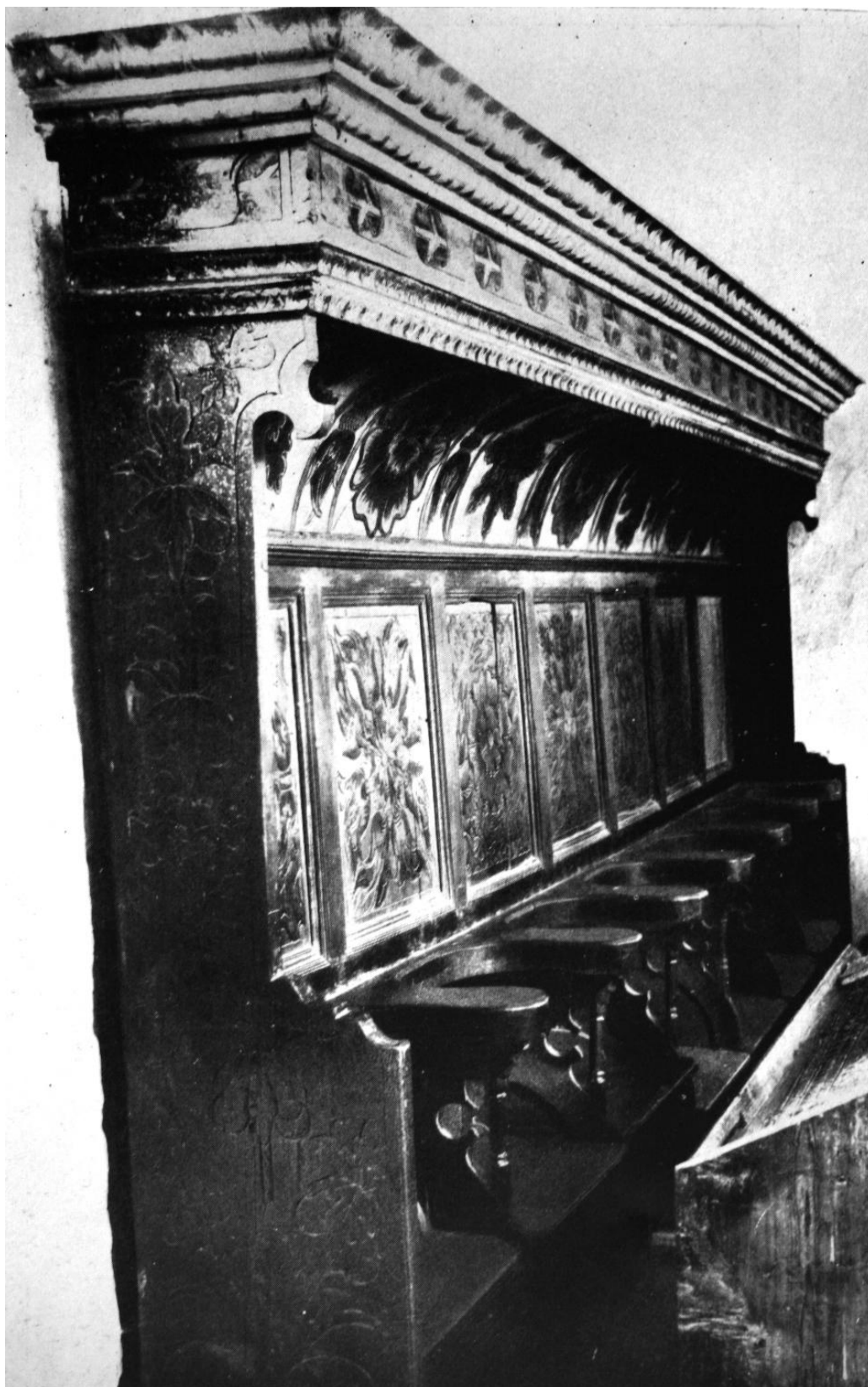
256. Baromlaka, ev. templom. Hétülékes stallum. 1526.