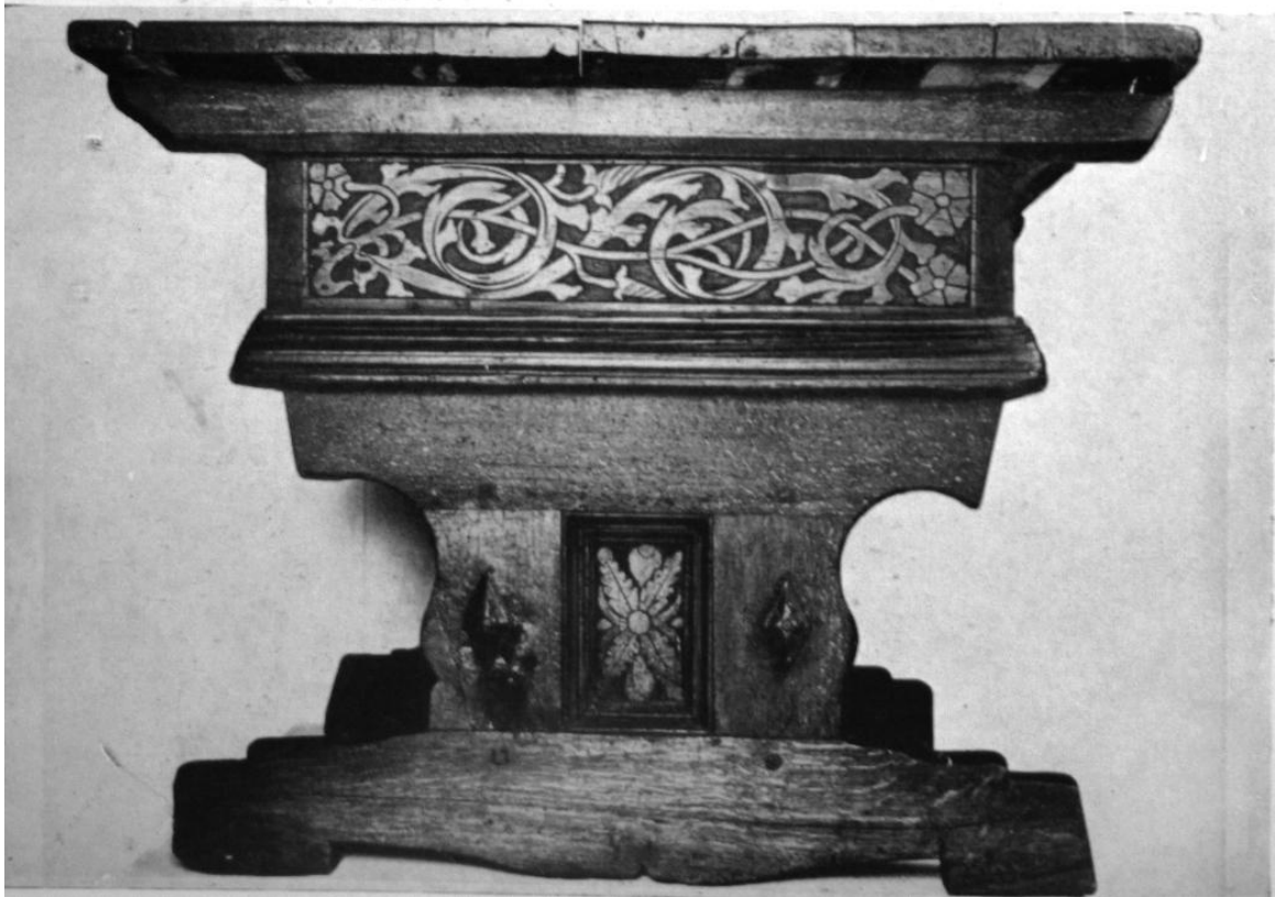
259—260. Erdélyi asztal. 1520—1530 körül. Budapest, Magyar Történeti Múzeum.