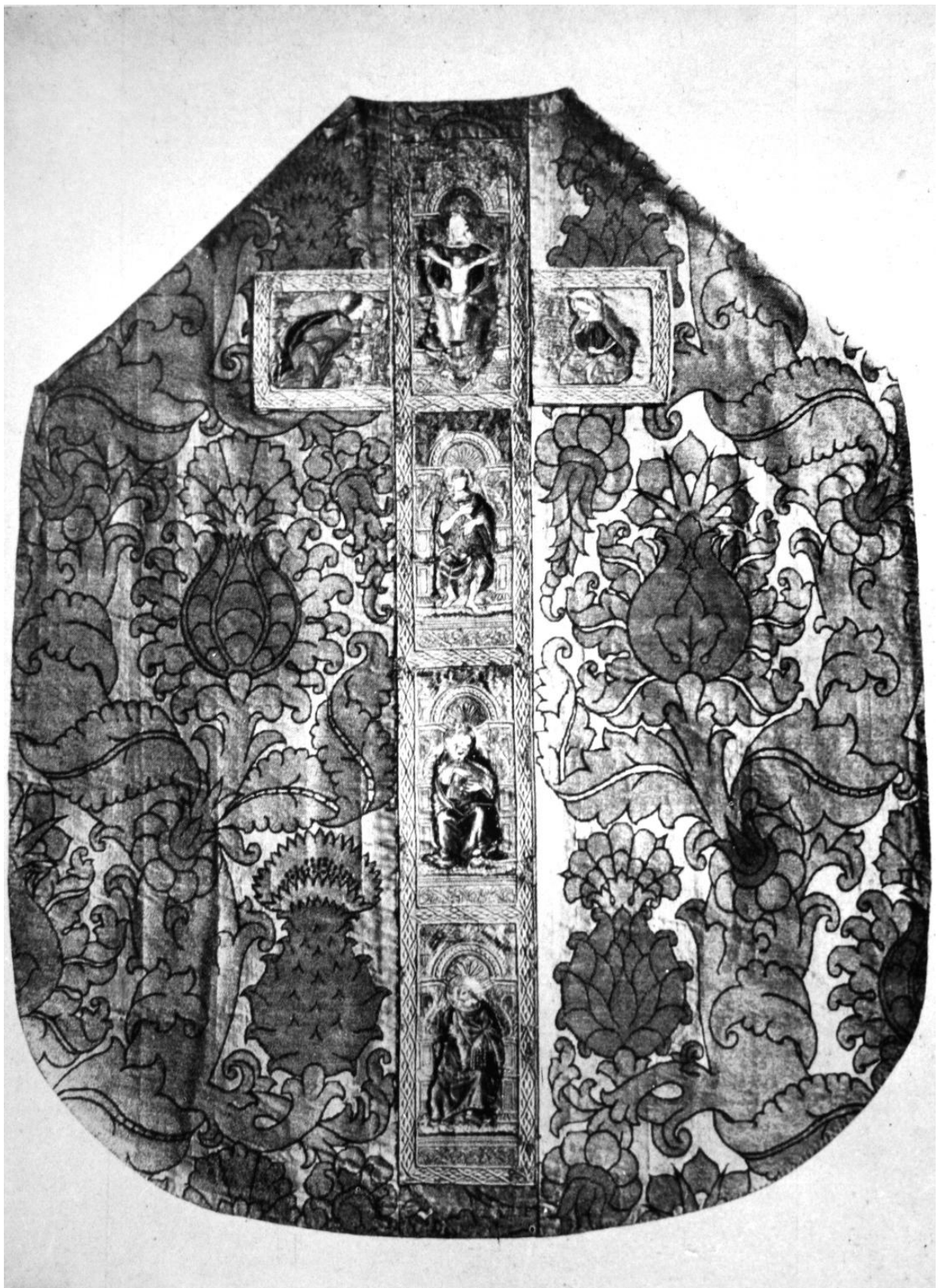
276. A nagszebeni templom miseruhája. XV. század vége. Nagyszeben, Brukenthal Múzeum.