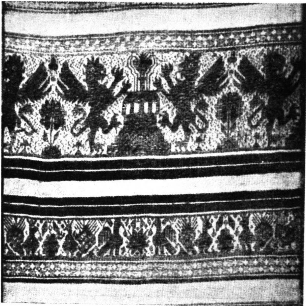
281. Perugiai szőttes. XV. század. Perugia, Museo dell'Università.