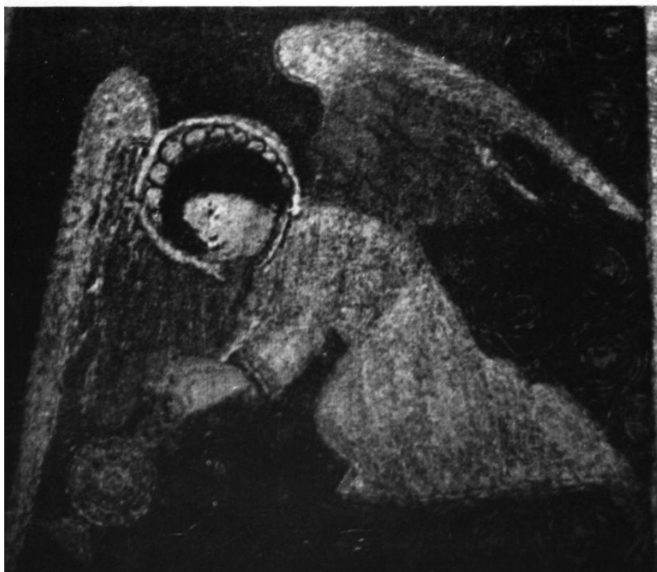
277—278. Részletek a kézdiszentléleki miseruháról.