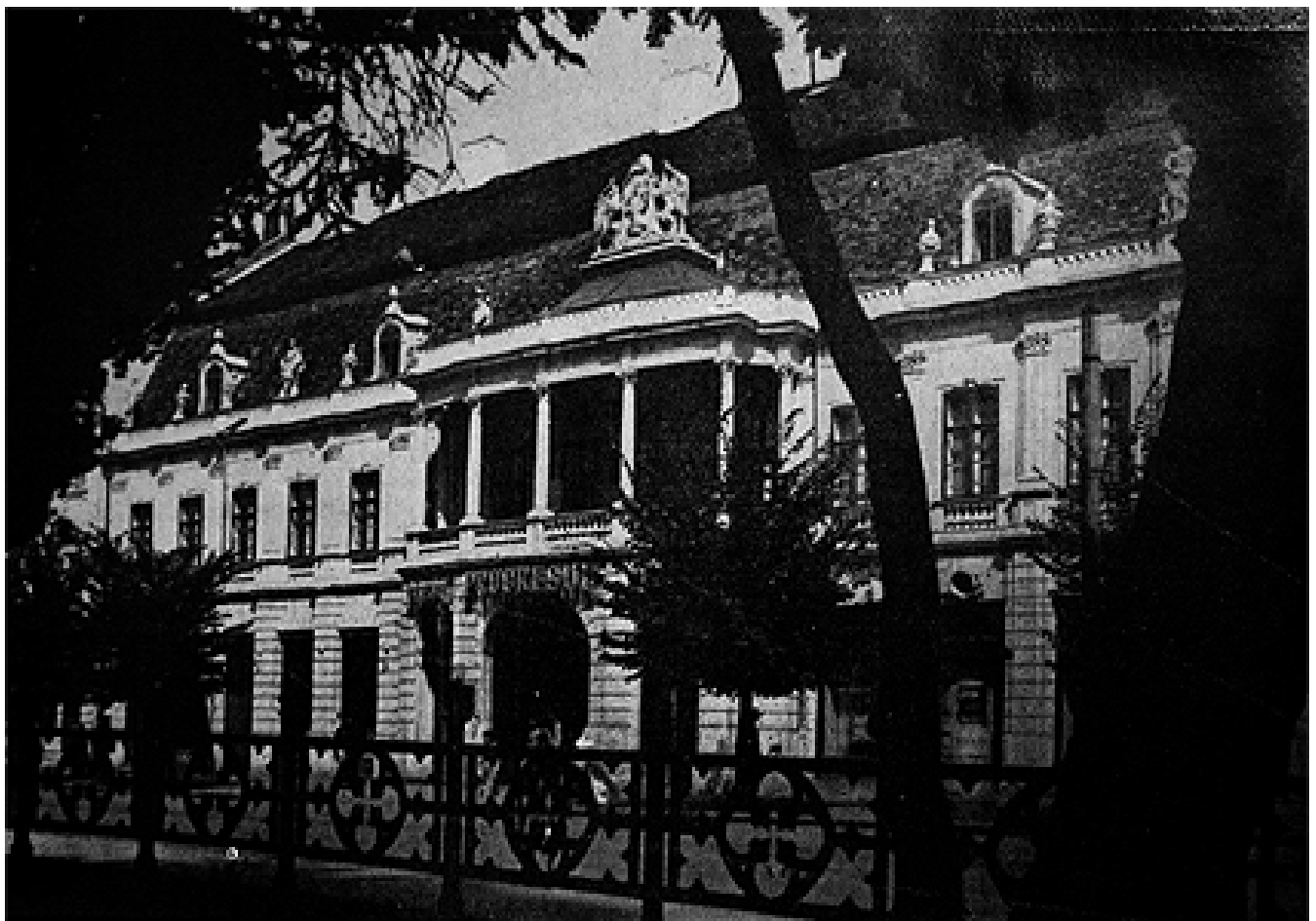
193. Kolozsvár, Bánffy palota homlokzata.