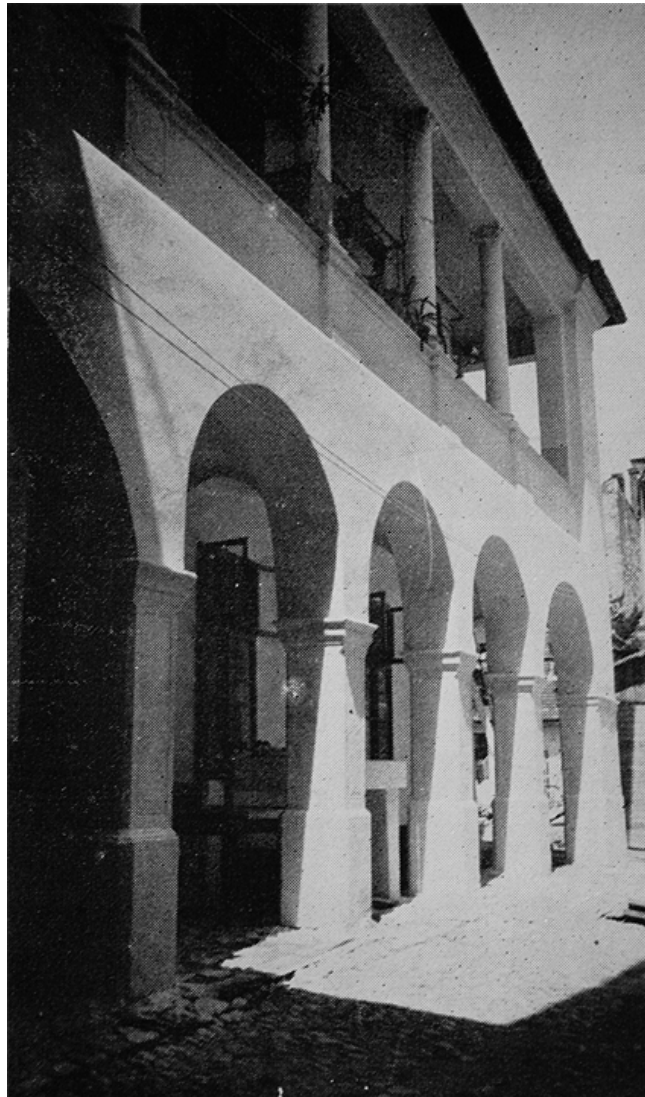
199. Kolozsvár, Thoroczkai ház, udvari részlet.