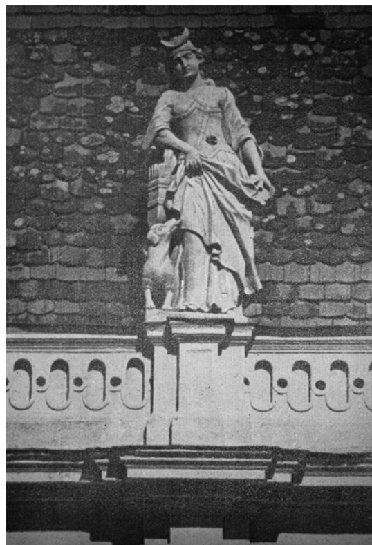
195. Diána alakja a kolozsvári, Bánffy palota homlokzatáról.