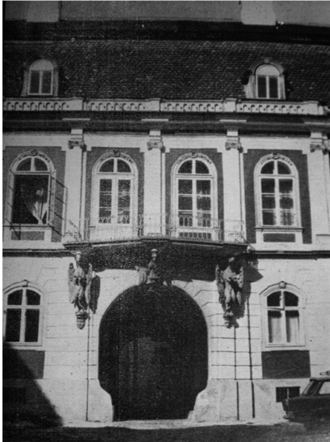
194. Kolozsvár, Bánffy palota udvari homlokzatának részlete.