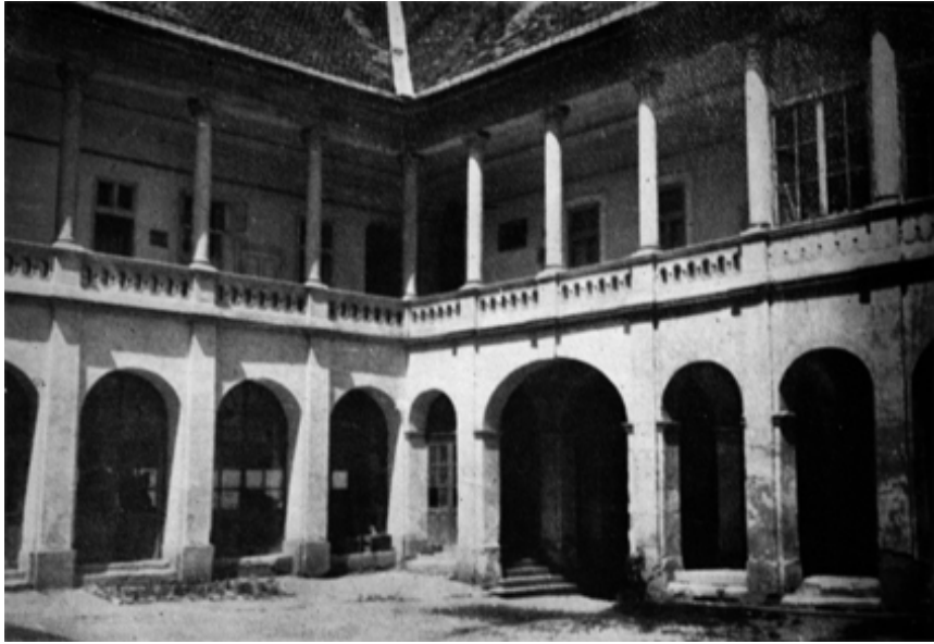
198. Kolozsvár, Toldalagi—Korda palota, udvari részlet.