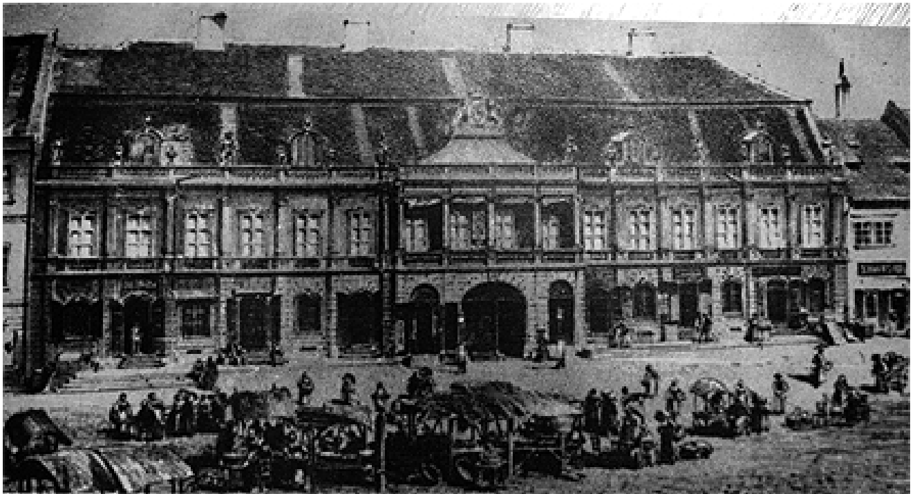
192. Kolozsvár, Bánffy palota 1870-ben.