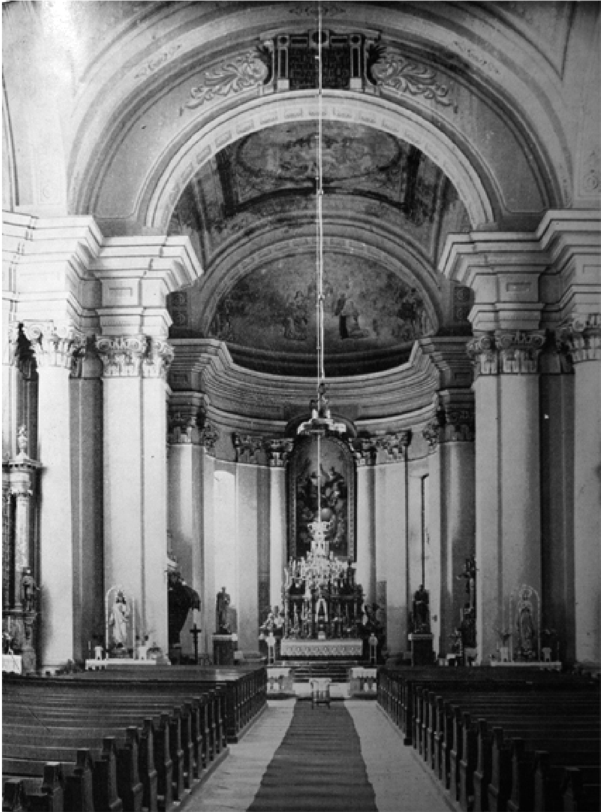
205. Szamosújvár, örmény nagytemplom, belső.