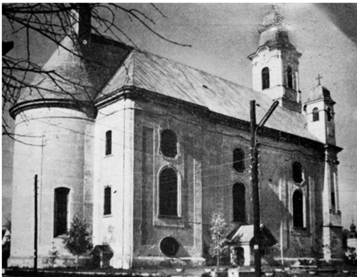
203. Szamosújvár, az örmény nagytemplom főhomlokzata.