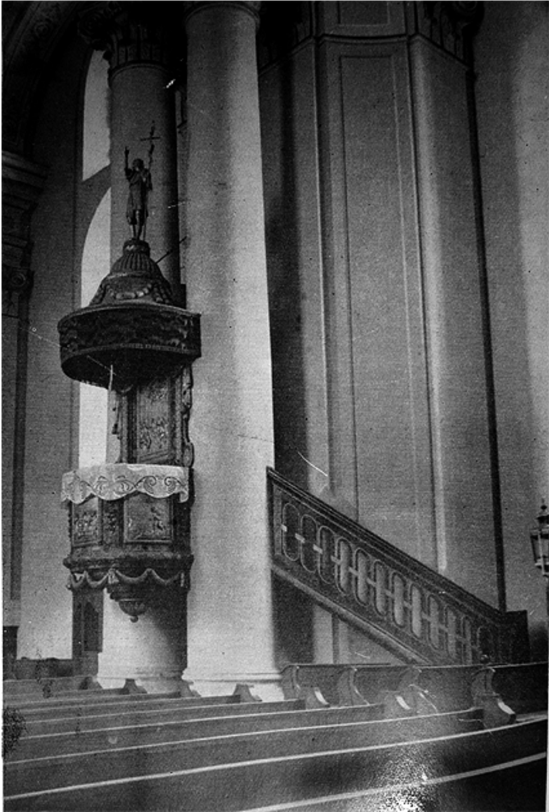
209. Szamosújvár, örmény nagytemplom, szószék.