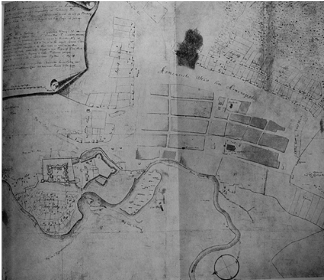
200. Szamosújvár térképe 1750-ből.