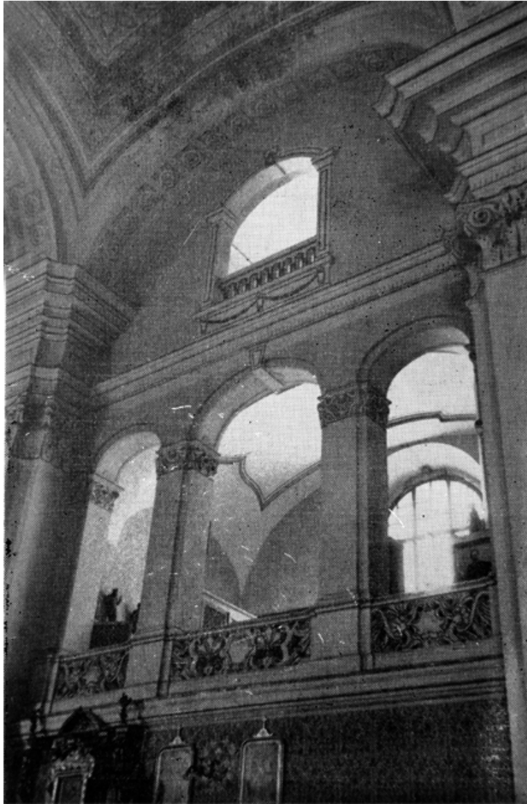
207. Szamosújvár, örmény nagytemplom, oldalkarzat.