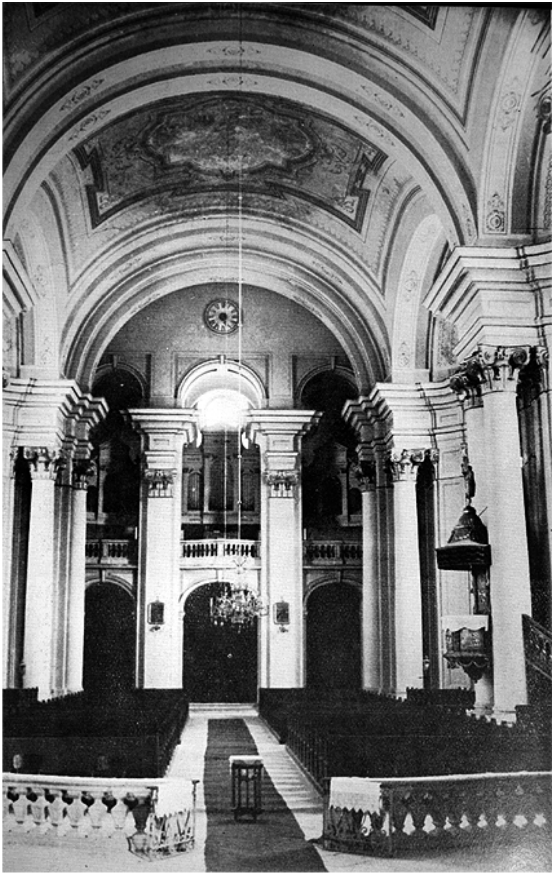
206. Szamosújvár, örmény nagytemplom, orgonakarzat.