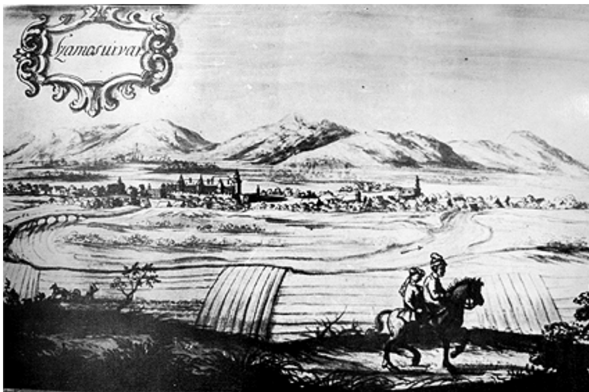
202. Szamosújvár látképe 1735-ből.