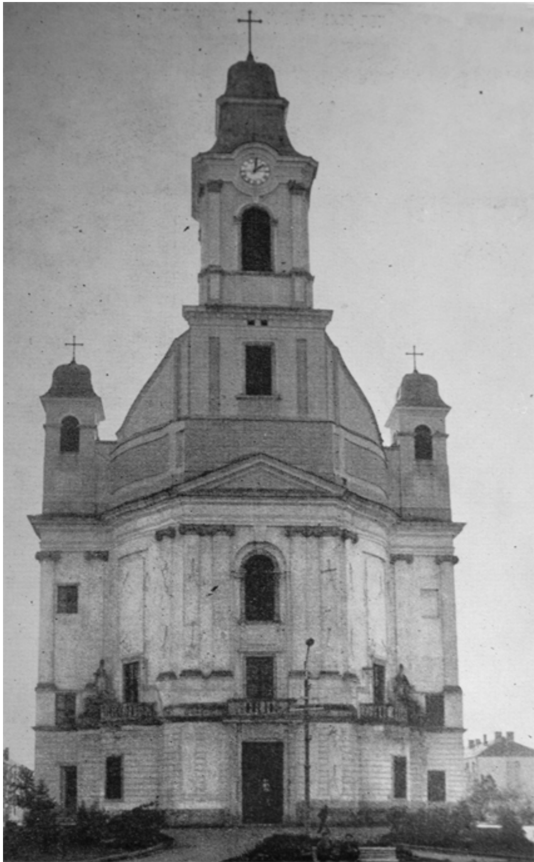
204. Szamosújvár, az örmény nagytemplom főhomlokzata.