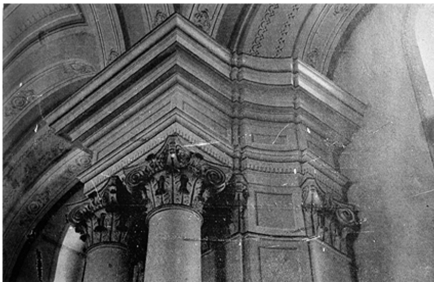
208. Szamosújvár, örmény nagytemplom, oszlopfők és párkány.