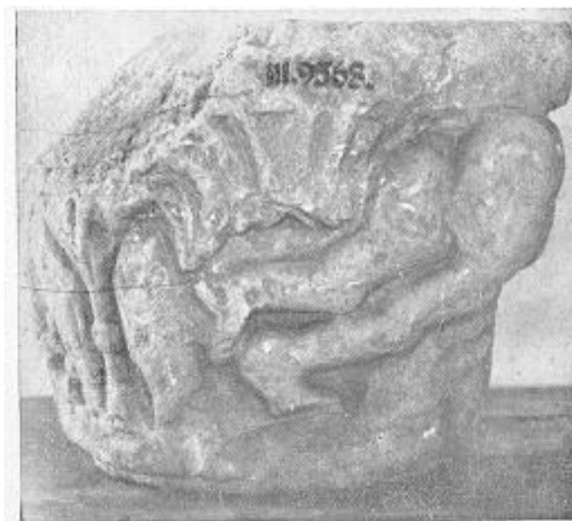
A magyarszentpáli oszlópfő