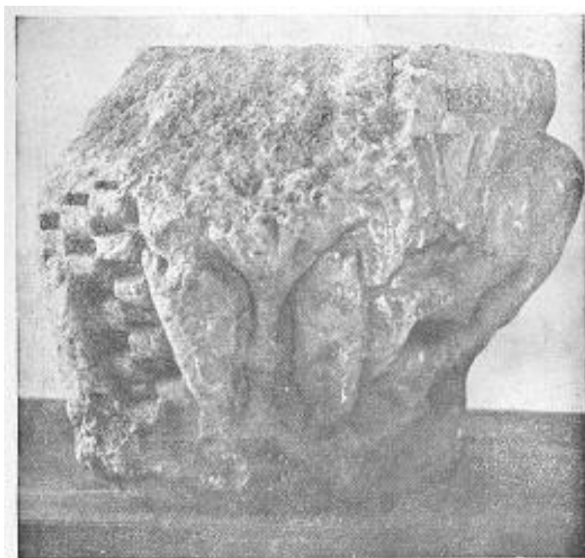
A magyarszentpáli oszlópfő