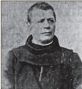
Tima Dénes József OFM (P. György József: A ferencrendiek élete és működése Erdélyben. – Kolozsvár, 1930)