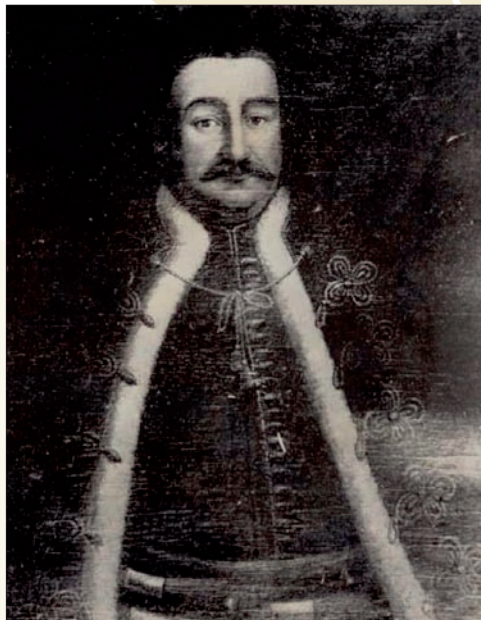
Apor István gróf