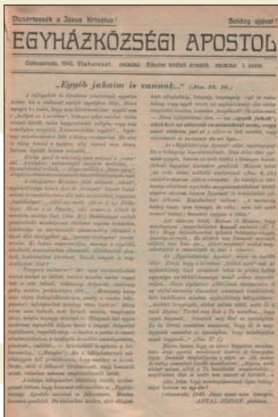
Az Egyházközségi Apostol első száma