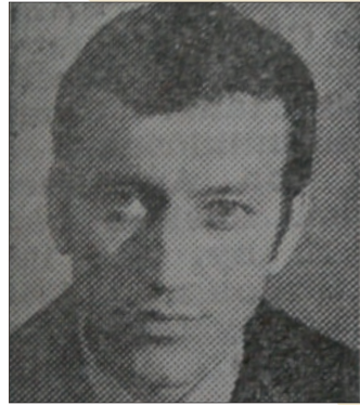
Gergely István

Öt éve, 2008. március 9-én hunyt el Gergely István képzőművész. Kozmásban született 1939-ben. A marosvásárhelyi Művészeti Középsiskola elvégzése (1958) után a Ion Andreescu Képzőművészeti Főiskola szobrászati tanszékén szerzett diplomát (1964). Kiváló karakterérzékkel örökölte meg a történelem hőseit, az erdélyi irodalom, tudomány és művelődés jeleseit. A kolozsvári Brassai Sámuel Ipari Líceum őrzi Apáczai Csere Jánosról készült magasdomborművét, Gábor Áron-mellszobra Sepsiszentgyörgyön, Bod Péter-mellszobra és a Végh Antalról, Gábor Áron munkatársáról készült mellszobra Csernátomban áll. Benedek Elekről készült egész alakos szobrát a kisbaconi Benedek Elek Emlékház előtti parkban helyezték el. (A Romániai Magyar Irodalmi Lexikon nyomán)