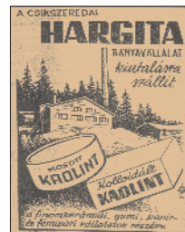
A Hargita Bányavállalat reklámja (Vörös Zászló, 1967. december)

Ötven éve, 1963-ban több kisebb kitermelőegység egyesítése révén jött létre a Hargita Bányavállalat. Az 1981-es Hargita Kalendárium adatai szerint a hargitafürdői kaolin kitermelése 1953-ban kezdődött. Az első években itt évente 3000 tonna A-típusú mosott kaolint állítottak elő az elektrokerámiapiar számára. 1958-ban megkezdtek a kolloidális, 1968-ban a fehéritett kaolin előállítását. 1975 végén helyezték üzembe Csíkszeredában a kaolin-feldolgozót, ahová a kaolin Hargitafürdőről egy 14 km hosszú vezetéken, szabadeséssel érkezett. 1980-ban a vállalatnál több mint 1400 bányász dolgozott.