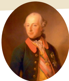
József főherceg 1775–80 körül