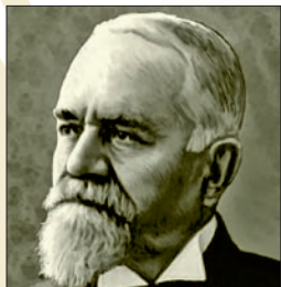
Titu Maiorescu (www.scrierile.com)

Kilencvenöt éve, 1918. április 17-én alakult meg Csík vármegye Méhészeti Egyesülete . Első elnöke Szabó István csíksomlyói tanítóképezdei tanár volt.