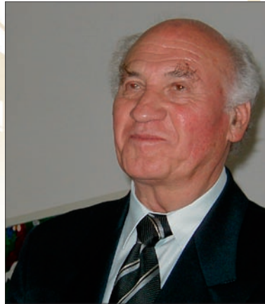
Domokos Géza

Nyolcvanöt éve, 1928. május 18-án született Brassóban Domokos Géza író, műfordító, kiadó, politikus, az RMDSZ első elnöke. Elemi iskolát Zágónban, a középiskolát Sepsiszentgyörgyön végezte. A kolozsvári Bolyai Tudományegyetemen kezdte a bölcsészszakot, majd egy év után Moszkvában a Makszim Gorkij Irodalmi Intézetben Pausztovszkij tanítványa lett. Visszatérve Romániába, az Előre, a Pionír és az Ifjúmunkás szerkesztőségében dolgozott. 1961-től a bukaresti Irodalmi Könyvkiadó nemzetiségi részlegének főszerkesztője, 1970-től a Kriterion Könyvkiadó igazgatója lett. Az Irodalmi Könyvkiadónál töltött évek alatt indultak el a Romániai Magyar Írók, a Horizont és a Forrás sorozatok. Domokos Géza 1989 decemberében az RMDSZ egyik alapítója volt, ő lett a Szövetség első elnöke, és 1992-ig egyik parlamenti képviselője. (A Romániai Magyar Irodalmi Lexikon és az RMDSZ által kiadott gyászjelentő nyomán)