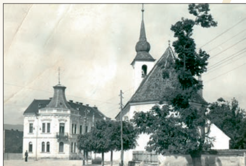
A plébániatemplom 1940 körül