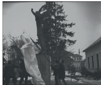
A Petőfi szobor leleplezésének pillanata

Az 1848-as forradalomról való megemlékezések részeként, negyven éve, 1973. december 29-én leplezték le Doru Popovici Bálcescu- és Szobotka András Petőfi-szobrát a csíkszeredai Mikó-vár előtt. Az ünnepséget a korabeli sajtó beszámolója szerint Ráduly Elek, az RKP városi bizottságának első titkára, a város polgármestere nyitotta meg. A szobrokat Fazekas Lajos, az RKP Hargita Megyei Bizottságának első titkára leplezte le. A forradalmárok jelentőségét Nicu Vrabie, Antal Imre és Becze Antal méltatták. Az ünnepség résztvevői, a korszak szokása szerint, táviratot intéztek Nicolae Ceaușescu pártfőtitkárhoz is. Az alkotásokat, a Vár tér rendezési munkálatainak részeként,