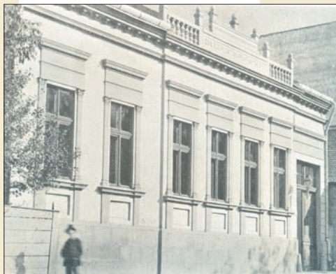
A Csíkszeredai Takarékpénztár Részvénytársaság székhelye 1908-ban (A Csíkszeredai Takarékpénztár Részvénytársaság Emlékkönyve)