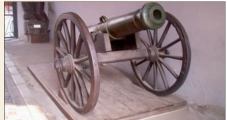
A Gábor Áron műhelyében készült ágyúk egyetlen fennmaradt példányáról készült másolat a kézdivásárhelyi Céhtörténeti Múzeumban

Kétszáz éve, 1814. november 27-én született Bereckben Gábor Áron, az 1848–49-es forradalom ágyúöntője és tüzértisztje. 1828-tól a csíksomlyói gimnáziumban tanult. 1831-ben, anélkül, hogy a középiskolát befejezte volna, Gábor Áron abbahagyta a csíksomlyói tanulmányait. Kézdivásárhelyen a 2. számú székely határhozrendnél szolgált katonaként, majd Gyulafehérváron, Budapesten és Bécsben szerzett tüzérségi ismereteket, hallgatott katonai műszaki előadásokat. 1846-ban végleg leszerelt. A szabadságharcban öntött ágyúit először 1848. november 30-án, a hidvégi csatában használták. Májusban Bem József tüzér őrnagynak, Kossuth Lajos a székelyföldi hadigyárak igazgatójának nevezte ki. Gábor Áron összesen 93 ágyút öntött (bár a