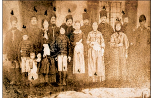
A csíktaplocai Xántus család 1864-ben (Vorkori György: Csíkszereda és Csíksomlyó képes története)

Százhusz éve, 1894. december 13-án hunyt el Budapesten Xántus János utazó, néprajz- és földrajztudós. Xántus János Csokonyán született, görög eredetű, csíktaplocai család sarjaként 1825-ben. Eredetileg jogot tanult, majd önkéntes nemzetőrként vett részt az 1848–49-es szabadságharcban; annak bukása után Königsgratz várában raboskodott. 1850-ben Angliába, majd Amerikába emigrált. Ott kezdett el növényeket és állatokat gyűjteni, preparálni, megfigyeléseket, tudományos munkát végezni. 1864-ig főként Amerikában élt, ekkor végleg hazatelepült. Ugyanebben az évben, erdélyi körútja során, Csíktaplocára is ellátogatott, megismerkedett itthoni rokonaival. A taplocai Xántus család tagjait lefényképezette. 1866-ban ő alapította meg a budapesti Állatkertet. 1868-tól kelet-ázsiai gyűjtőexpedíciókban vett részt, mintegy 2500 darabos etnológiai gyűjteményt hozva magával, letéve a Nemzeti Múzeum néprajzi osztályának, a későbbi Néprajzi Múzeum