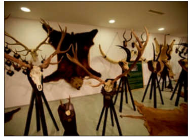
Windischgrätz Ferenc József trófeagyűjteménye a keszthelyi Helikon Kastélymúzeumban ( http://hellkonkastely.hu/ )

Hetvenöt éve, 1939. április 28-áról 29-ére virradólag világrekordnak számító medvét ejtett el Windischgrätz Ferenc József herceg a csikjenőfalvi határban fekvő Fábán nevű erdőrészből. A medve korábban három évig tartotta rettegésben a környéket és megbénította a havasi legeltetést. Ferenc József Windischgrätz herceg „egy jól irányzott mesteri lövéssel pontot tett a havasok rémének garázdálkodására. A siker oroszlánrésze Kovács Gyula fővadászmestert illeti” – számolt be az eseményről a Csíki Lapok 1939. május 7-én. „A herceg öröme leírhatatlan, mert az elejtett medve világvizonylatban is számottevő. (...) A hossza, lemérés után 241 cm, s a sulya, dacára annak, hogy tavasz van, 270 kg.” A medve bőre a keszthelyi Helikon Kastélymúzeumban található.