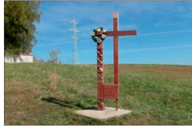
A kivégzés helyén álló kereszt Csíkmadarason