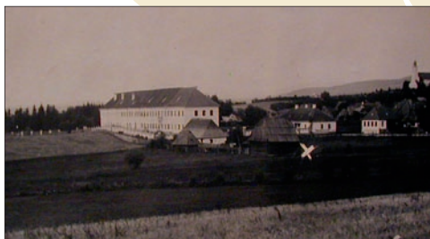
A csíksomlyói gimnázium épülete a 20. század elején