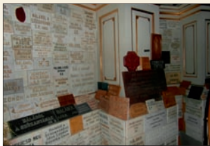
Offerek és hálatablák a csíksomlyói kegytemplomban

Kétszázharminc éve, 1784-ben Batthyány Ignác püspöksége alatt került sor a harmadik egyházi vizsgálatra a csíksomlyói Mária-szobor körüli csodás gyógyulásokkal és egyéb csodás eseményekkel kapcsolatosan. Az első egyházi vizsgálat 1746-ban, a második 1779-ben zajlott. A Batthyány Ignác által elrendelt és 1784-ben befejezett vizsgálat a csíksomlyói kegyszobrot „csodákkal jeleskedőnek” nyilvánította. A csíksomlyói Szűzmária közbenjárására bekövetkezett csodás gyógyulások ma is tartanak, erről tanúskodnak a kegytemplom oltárának közelében elhelyezett offerek, vagyis fogadalmi