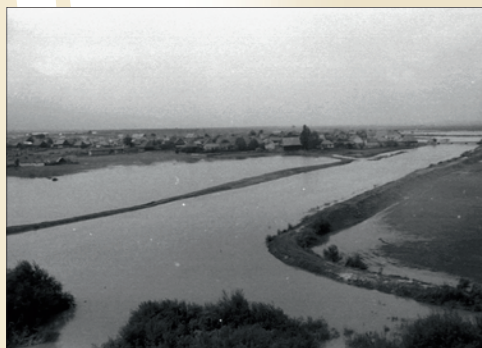
Áradás az Olt-on az 1970-es években.

Száz éve , 1914. június 13-án zajlottak az első mozsizkeccs előadások Csíkszeredában.