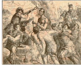
Dózsa György kivégzése

Ötszáz éve, 1514. július 20-án kínozták halálra Dózsa György paraszvezért. Dózsa György Dálnokon született 1470 körül. Katonai pályára lépett, Szapolyai János erdélyi vajda 1513-as törökök elleni hadjáratában lovaskapitányként vett részt. A hadjárat után a nándorfehérvári őrsgében maradt. Amikor Bakócz Tamás esztergomi érsek kihirdette a törökök elleni kereszties hadjáratot, a kereszties hadsereg vezérévé Dózsa Györgyöt jelölte ki. Május közepére az országban mintegy 40 000 fős paraszti had gyűlt össze vezetése alá, azonban szervezési hiányosságok, Bakócz visszakozása, a keresztiesháború lefújására tett kísérletek, a nemesek ellenkezése és az akkor uralkodó viszonyok együttesen a felkelés kirobbanásához vezettek. Dózsa György seregével sok diadalt aratott és elfoglalta a Maros menti várak többségét, de 1514. július