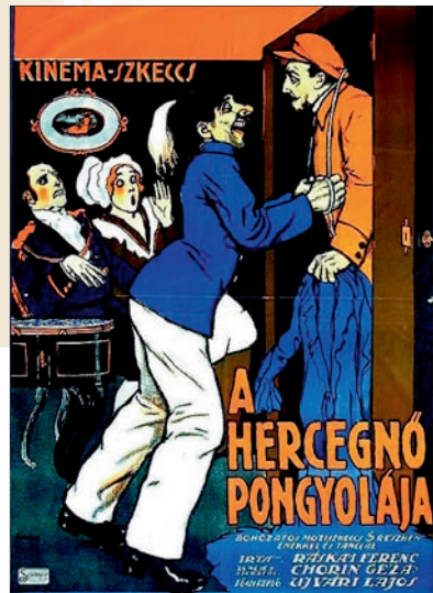
A hercegnő pongyolája. Plakát 1914.