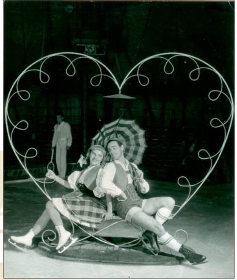
Jelenet a Magyar Jégrevü egyik előadásából