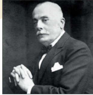
Constantin Anghelescu (bookaholic.ro)

„A román kultúrznát Constantin Anghelescu közoktatási miniszter 40.771/1924-es számú rendelete és az állami oktatásról szóló 1924. évi törvény 159. szakasza teremtette meg” – olvasható György Béla A romániai Országos Magyar Párt története című munkájában. – „A román oktatás intenzívebbé tétele érdekében vegyes lakosságú országrészekben elrendelte egy olyan kultúrövezet felállítását, amelyben a tanítószemélyzet iskolai és iskolán kívüli tevékenysége intenzívebb legyen. Ez az övezet Erdélyben Máramaros, Szatmár, Szilágy, Bihar, Temes-Torontál, Háromszék, Udvarhely és Csík megyéket foglalta magába. Az itt tevékenykedő tanerők 50%-os fizetési többletet és 10 hektár területet kaptak iskolai és iskolán kívüli működésükért.” A törvény következtében a román tanítók ellepték a magyarlakta vidékeket, és egyes iskolákban egyenesen diktató-