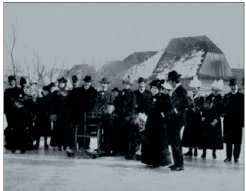
Korcsolyázók 1901-ben

A Csíkszeredai Korcsolya Egylet 1880-ban alakult. 1889-ben kárcsonyi korcsolyabállal szeretett volna pénzt gyűjteni a jégpálya létrehozására, de a remélt nagy bevétel elmaradt. Ennek ellenére megnyitották a korcsolyapályát 1889. december 26-án a Városháza mögötti réten. „A pálya megnyitására szép számban gyűltek össze a jégsporthoz kedvelői s jókedvűen iringáltak a csíkszeredai első zenekar hangjai mellett majdnem az egész délutáni idő alatt, daczára annak, hogy legalább is 20 fok hideg uralkodott s ez nagyon kívánatosá tette a meleg szobát.” Az ezt követő évtizedekben ez lett a színtere a korcsolyaversenyeknek és a hokimeccseknek. A kivilágított jégpályán gyakran zenekar szolgáltatott kísérőzenét a korcsolyázóknak.