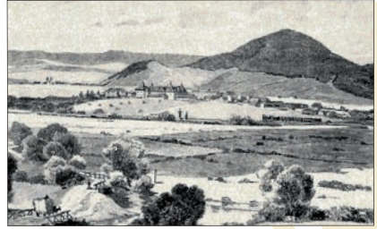
Csíkszereda. Illusztráció Hankó Vilmos Székelyföld című kötetéből

Százhatvan éve, 1854. március 2-án született Parajdon Hankó Vilmos kémikus, a MTA levelező tagja, Székelyföld borvizeinek, borvízfürdőinek jeles kutatója, Székelyföld népszerűsítésének elkötelezettje. Hankó Vilmos a kolozsvári egyetemen tanult, vegytanból és természettanból szerzett tanári képesítést, majd doktori vizsgát tett. 1877-től a dévai állami főreáliskola tanára, 1885-től a budapesti II. kerületi főreáliskola tanára, 1907-től igazgatója. Tanári munkája mellett fejtette ki tudományos és tudomány-népszerűsítő munkásságát, ugyanakkor Székelyföld természeti adottságait, gazdagságát, ásványvizeit népszerűsítette minden lehetséges helyen. Székelyföldről írt turistakalauzát (ahogyan Jancsó Benedek nevezte „az irodal-