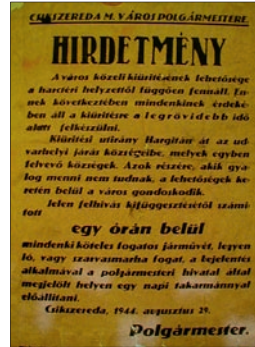
Polgármesteri hirdetés a város kiürítésére. Szeptemberben függesztették ki.