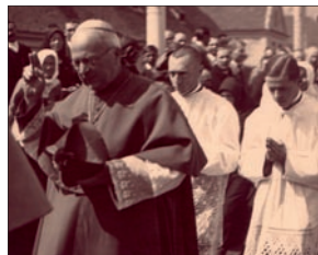
Majláth Gusztáv Károly püspök, mögötte Márton Áron Gyergyószentmiklóson