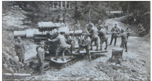
Elő világháborús katonai gyakorlat, valószínűleg az Úz völgyében

Száz éve, 1914. július 28-án üzent hadat az Osztrák–Magyar Monarchia Szerbiának, miután a belgrádi kormány és I. Péter király elutasította az öt nappal korábbi bécsi ultimátumot. A hadüzenet mozgásba hozta a szemben álló európai katonai szövetségeket, ezáltal néhány napon belül világméretű háború robbant ki, amely 15 millió ember életét követelte, és teljesen átrajzolta Európa és a világ politikai arculatát. Csíkszereda lakossága még azon a napon este, énekszóval, lelkesen üdvözölte a hadüzenetet. . . „Kedden este hire jött, hogy Szerbiának megüzentük formálisan is a háborút. A város már jórészt lenyugodott, de a hir annyira felvillanyozta a még sétáló közönséget, hogy csakhamar nagy csoportokba verődve, zajos ének szóval, rendkívül lelkes hangulatban bejárták a várost, mindenütt éltette a háborút.” – olvas-