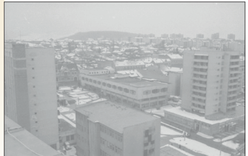
A Központi Áruház az 1970-es évek végén