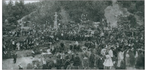
A Nyerges-tetői emlékmű leleplezése 1897-ben.

Százhatvanöt éve, 1849. augusztus 1-jén zajlott az 1848–49-es forradalom és szabadságharc egyik utolsó székelyföldi csatája. A Tuzson János vezette ütközetben a közhiedelem ellenére mindössze négy csíki székely, és valószínűleg ugyanannyi háromszéki honvéd esett el. „A nyergestetői csata fontossága nem a halottak nagy számában, hanem abban a végső erőfeszítésben rejlik, hogy egy legtöbb kétezer fős sereg megpróbált a többszörös, mintegy tizenkétezer fős túlerővel szembeszállni, és még egy utolsó próbálkozást tenni az ellenség feltartóztatására” – vélekedik Szócs János történész, aki szerint eléggé pontos kortárs feljegyzések vannak a csatára vonatkozóan, és ennek leírása a Honvéd című lapban is megjelent