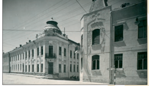
A Vigadó épülete. Képeslap

Száztiz éve, 1904-ben Szász Róbert építész-mérnök tervei alapján, a Csíki Magánjavak költségén épült a csíkszeredai Vigadó épülete. Megnyitására 1904. december 31-én került sor. Mindössze két hét-tel az átadás után kiderült, hogy nem felel meg az elvárásoknak, annak ellenére, hogy színpaddal és karzattal ellátott előadótermet, négy öltözőt, tizennégy vendégszobát, két éttermet, egy nagyteremből és két kártyaszobából álló kávéházat, egy nagyteremből, egy olvasóteremből és két kártyaszobából és egy előszobából álló kaszinót és szolgálati lakásokat is magába foglalt. A Vigadó nagytermében számtalan amatőr és hivatásos társulat mutatkozott be és itt működött az első csíkszeredai mozgóképszínház, majd a kommunizmus éveiben a Hargita filmszínház, amelyet az 1989-es