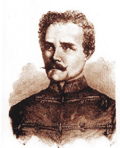
Gábor Áron őrnagy, ágyúöntő