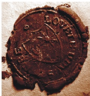
Lövéte község pecsétje, 1848-ban