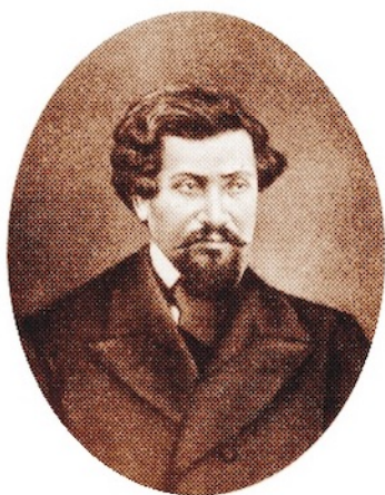
Gál Sándor ezredes, a székely haderő parancsnoka