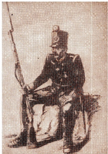
Székely gyalogos katona 1848-ban