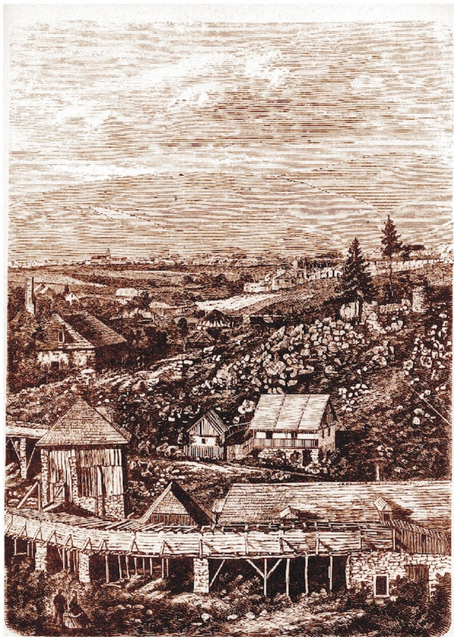
A szentkeresztbányai vashámor, a lövétei határban (1860-as évek).