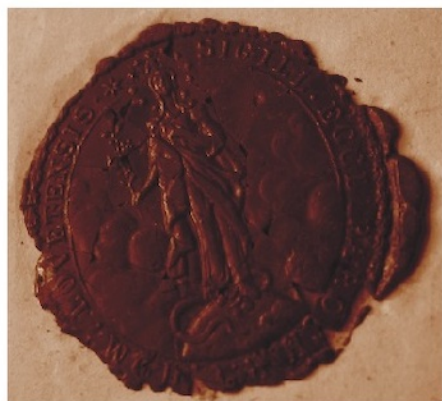
A lövétei egyházközség pecsétje, 1848-ban