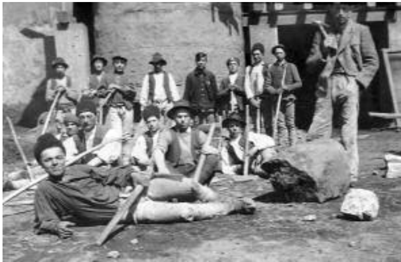
Lövétei bányamunkások (Rókváros, 1939)

A bányamunkások szakszervezeti csoportjának elsődleges célja a kollektív szerződés megkötése, a munkabérek, az általános munkafeltételek javítása, a munkatörvények legelemibb előírásainak (pl. fizetett szabadság) a betartatása volt. A vállalat vezetőse-