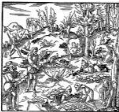
Felszíni bányászat (XVI. század)

Annál többet hallunk a „havas torkában” épült, a Hargita keleti oldalán fejedelmi tulajdonban lévő csíkmadarasi vashámorról, illetve sokféle létesítményéről (fa-, faszén- és vaskötartó csűr, ércpörkölő, olvasztók, istálló és fűrészma-