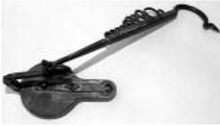
Régi bányázmécses (fonca)

hámortelep felvirágoztatásához. Az építkezések 1851-ben kezdődtek, de nem a Kerekfenyő völgyében, ahol az orosz hadak által részben felégetett, de kijavított régi kohó és hámorépület állt, hanem a Lobogó nevű egykori fürdőhely szomszédságában, vagyis a mai üzem területén.