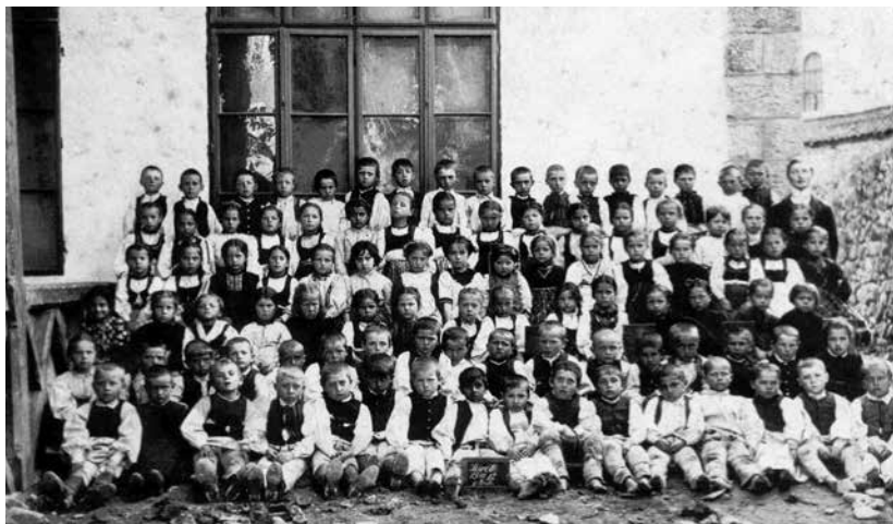
A Római Katolikus Népiskola I. osztálya (1912)