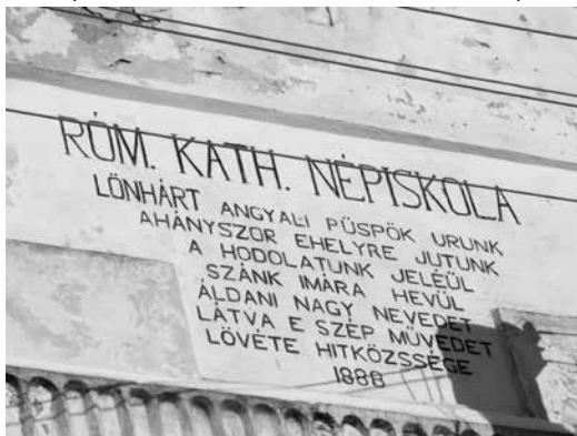
Az emlékfelirat az épület felújítás előtt