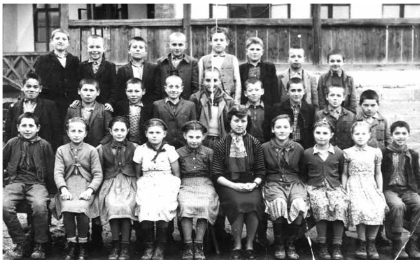
Az államosított Római Katolikus Népiskola egyik osztálya (1950-es évek)