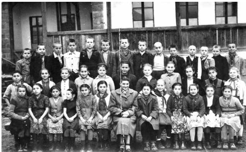
Az államosított Római Katolikus Népiskola egyik osztálya (1950-es évek)