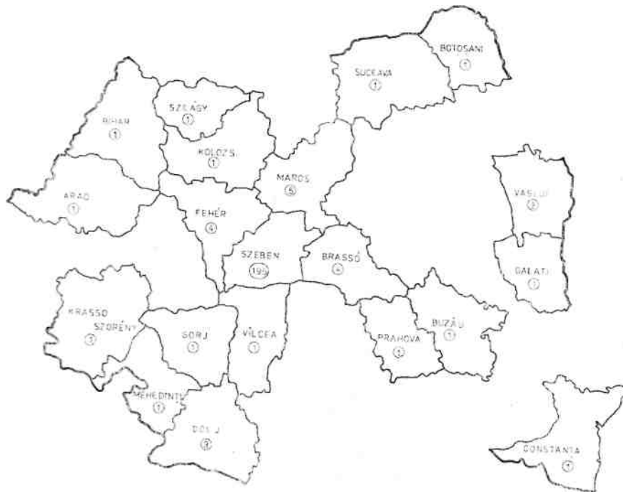
Az R. etnosz párválasztási helységei megyék szerint, a párkapcsolatok számával

Az R etnosznál 195 kapcsolat szerepel megyén belül és alig 34 megyén kívül, összesen 19 megyében.