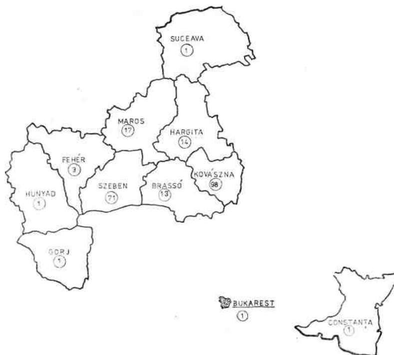
Az M etnosz párválasztási helységei megyék szerint, a párkapcsolatok számával

Az M etnosznál a 136 párkapcsolatból 71 a megyén belüli és 65 azon kívüli, mintegy 47%, és csak alig négy megye fordul elő egyszer (valamint Bukarest).